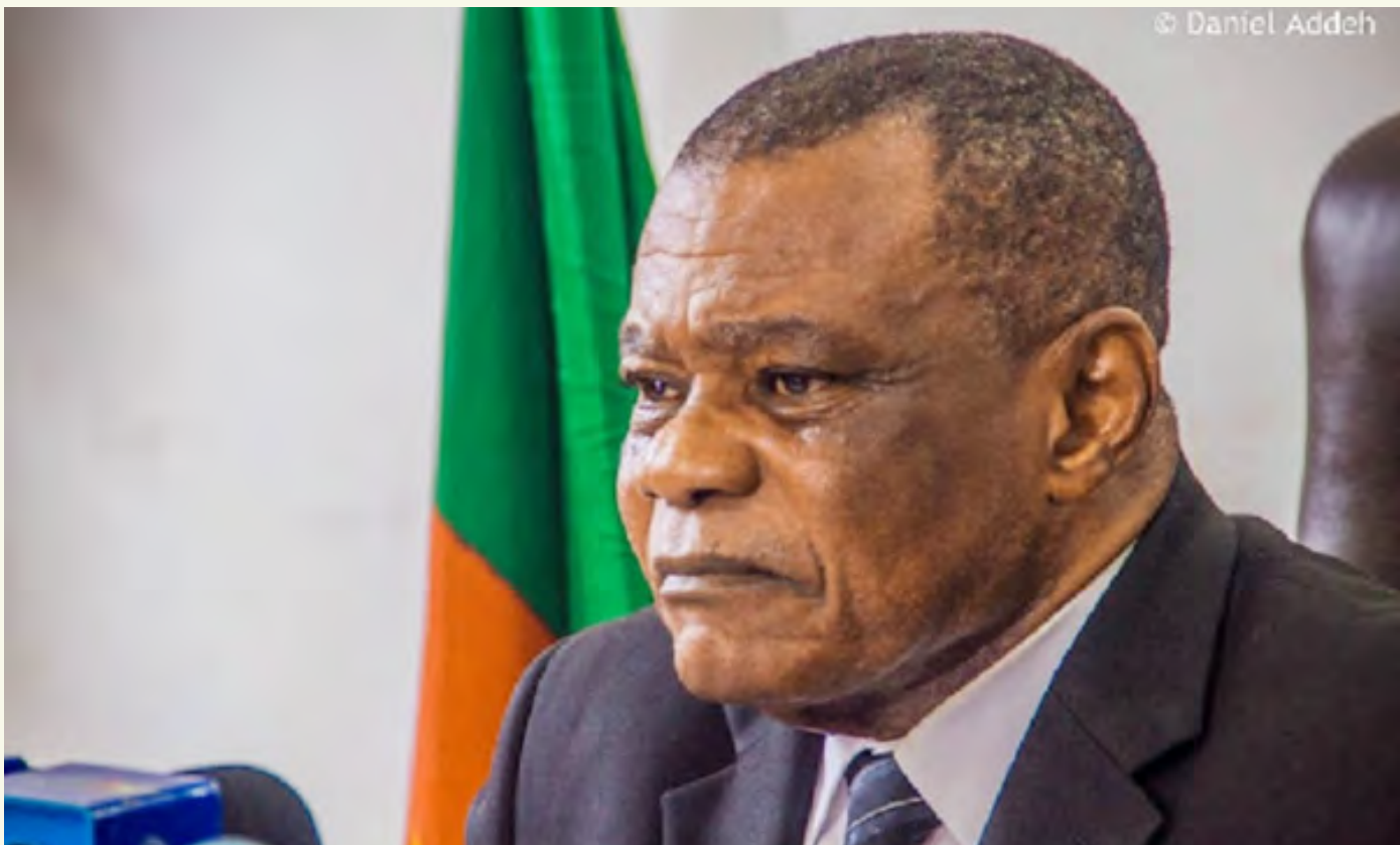
M. Peter ESSOKA, Président du CNC Cameroun, Président du RIARC

Dernière étape d'un processus électoral lancé en 2018, les toutes premières élections des conseillers régionaux dans l'histoire du Cameroun ont eu lieu le 06 décembre 2020 dans un climat de fortes tensions politiques. Entre les attaques de Boko Haram à l'Extrême-Nord, l'afflux des réfugiés centrafricains à l'Est et le conflit dans le Nord-ouest et le Sud-ouest, cette échéance électorale a été marquée par la prolifération des messages de haine et la désinformation dans le champ médiatique avec un risque sérieux de détérioration de la cohésion sociale nationale.