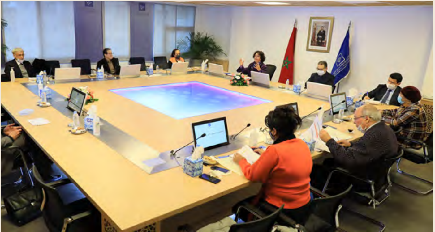
Vue partielle des participants au séminaire

Du 25 novembre qui coïncide avec la Journée internationale pour l'élimination de la violence à l'égard des femmes au 10 décembre 2020 (Journée des Droits de l'Homme), la Haute Autorité de la Communication Audiovisuelle du Maroc a contribué pour la troisième année consécutive à la campagne 16 jours d'activisme contre la violence faite aux femmes et aux filles, conçue et organisée par l'ONU Femmes comme un événement annuel de sensibilisation à l'échelle internationale.