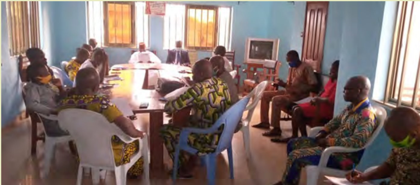
Séance de vulgarisation de la Décision avec les professionnels des médias dans le Zou

En prélude à l'élection présidentielle du 11 avril 2021, l'institution chargée de la régulation des médias au Bénin pose les différentes balises dans le cadre de ses activités pour une gestion réussie de la campagne médiatique de ladite élection.