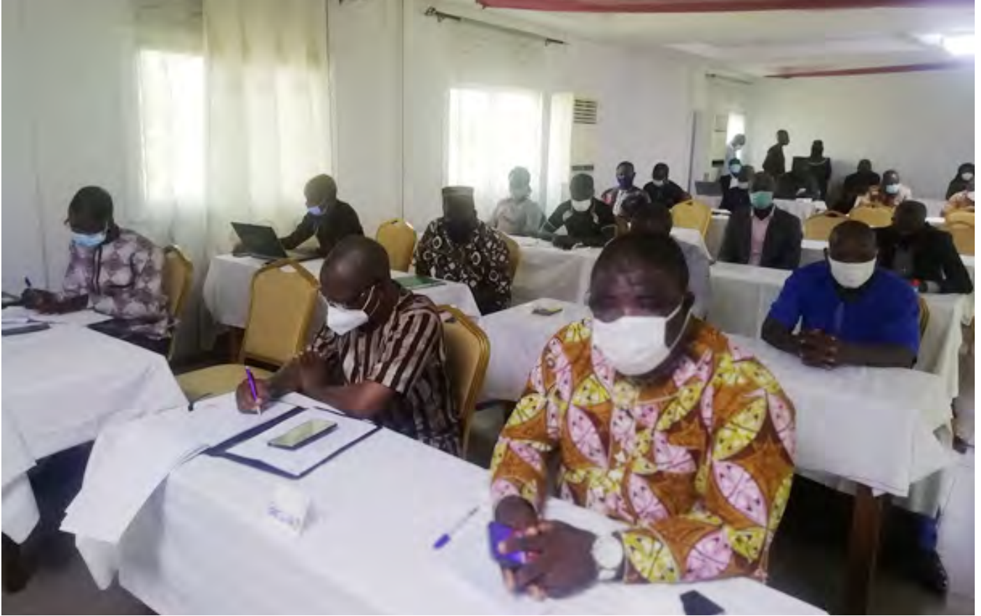
Vue partielle des professionnels des médias, participants à la séance de sensibilisation

des contributions et suggestions pour une meilleure application de certains textes.