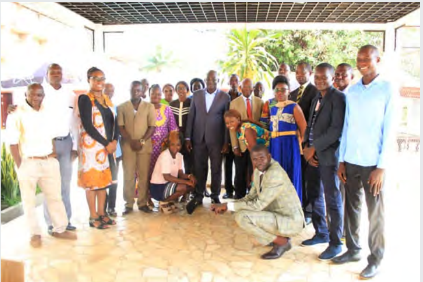
Photo de famille des participants au Séminaire en vue de la supervision électorale

Depuis l'installation de la nouvelle équipe du Haut Conseil de la Communication en 2016, l'Institution en charge de la régulation des médias en Centrafrique s'est donnée les moyens à travers les appuis multi-formes, surtout des partenaires, pour organiser d'une manière responsable la campagne médiatique des échéances électorales de 2020 et 2021