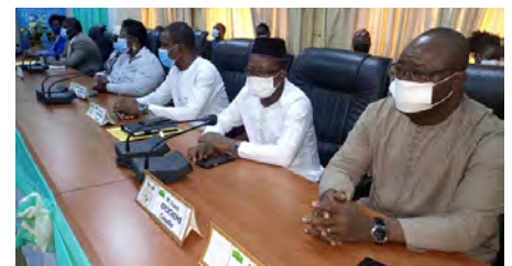
Vue partielle des Conseillers à la HAAC, à l'ouverture de la première session ordinaire de l'année 2021

aspirent pendant la campagne est étroitement liée à la bonne gestion de la période de précampagne », a-t-il souligné. Il faut préciser qu'à la fin de l'ouverture de la première session ordinaire, les Conseillers de la sixième mandature de la Haute Autorité de l'Audiovisuel et de la Communication, se sont rendus dans les différentes communes du Bénin pour apprécier l'impact de la Décision N°21-002/HAAC du 13 janvier 2021, portant règle-