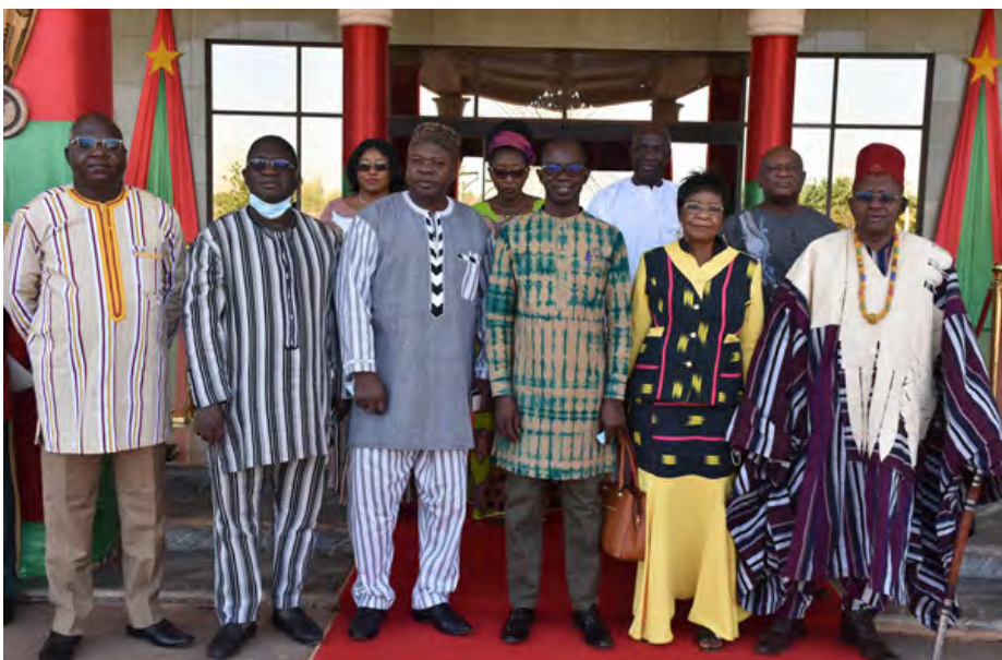
Photo de famille de la délégation du CSC qui s'est rendu au Palais de la République

Dans sa réponse, le président KABORE a félicité le Conseil supérieur de la communication pour l'organisation réussie de la couverture médiatique des élections couplées du 22 novembre 2020. Toute chose qui a permis d'avoir un scrutin apaisé et des résultats acceptés de tous. Il a promis d'examiner avec la plus grande attention les points inscrits dans ce rapport, notamment ceux qui permettront au CSC de mieux remplir ses missions pour la consolidation de la démocratie.