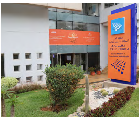
Vue partielle du siège de la HACA

La Direction de la Coopération Internationale