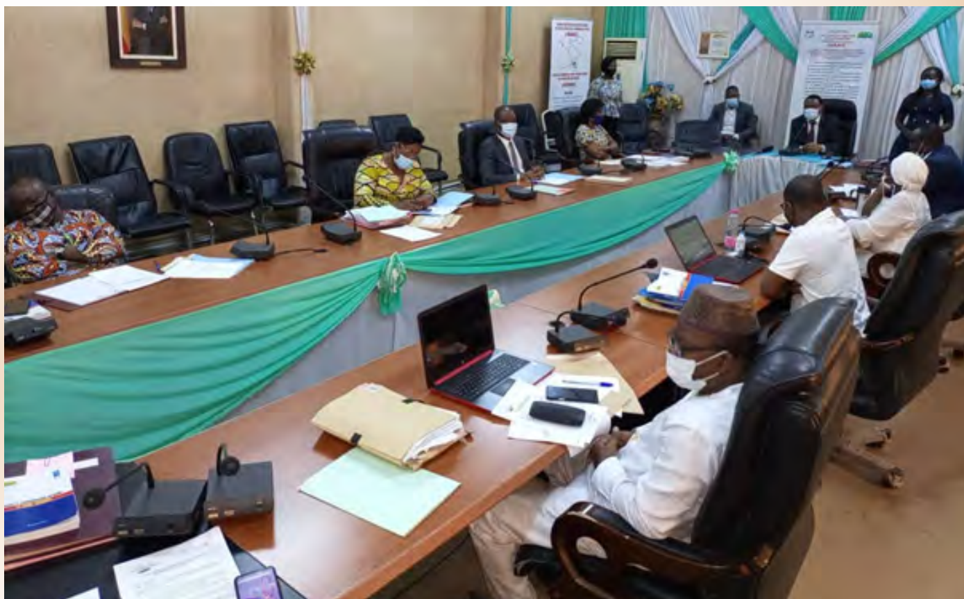
Vue partielle des participants

C'est par un communiqué en date du 19 janvier 2021 que la Haute Autorité de l'Audiovisuel et de la Communication (HAAC) a lancé l'appel à candidatures pour la sélection de sites internet fournissant des services de communication audiovisuelle ou de presse destinés au public. La procédure ainsi enclenchée est en conformité avec les dispositions de l'article 252 de la Loi n°2015-07 du 20 mars 2015 portant code de l'information et de la communication.