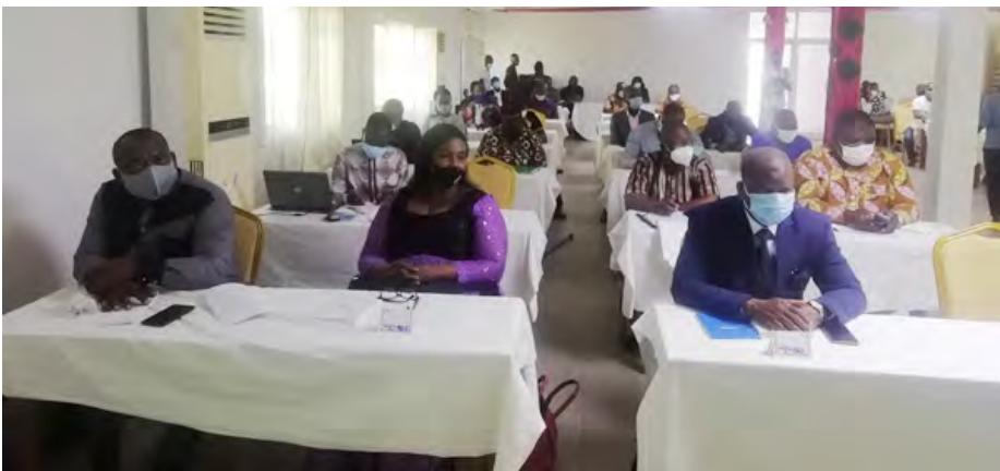
Vue partielle des professionnels des médias, participants à la séance de sensibilisation avec en première ligne des Conseillers à la HAAC Togo

Dans la suite de son programme d'activités, la HAAC prévoit d'organiser une pareille session de formation à l'intention des professionnels des médias écrits et audiovisuels des régions septentrionales du Togo au cours du premier trimestre de 2021.