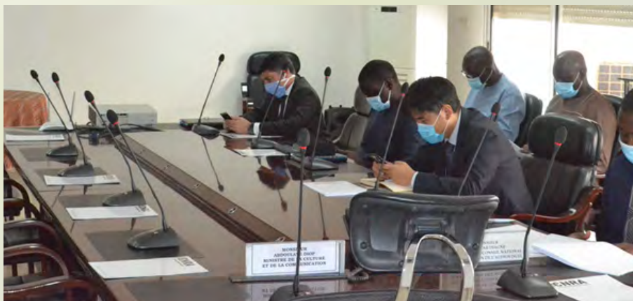
Les Editeurs à l'occasion de la rencontre de partage et de validation des nouveaux textes qui les régiront.

Le Conseil national de Régulation de l'Audiovisuel et le Ministère de la Culture et de la Communication, en initiant ces rencontres, ont jeté les bases d'une bonne compréhension des dispositions des textes soumis qui, une fois adoptés, vont désormais régir les divers Editeurs télévisuels privés et les Distributeurs ainsi que les rapports entre les Editeurs, les Distributeurs et l'Opérateur de diffusion.