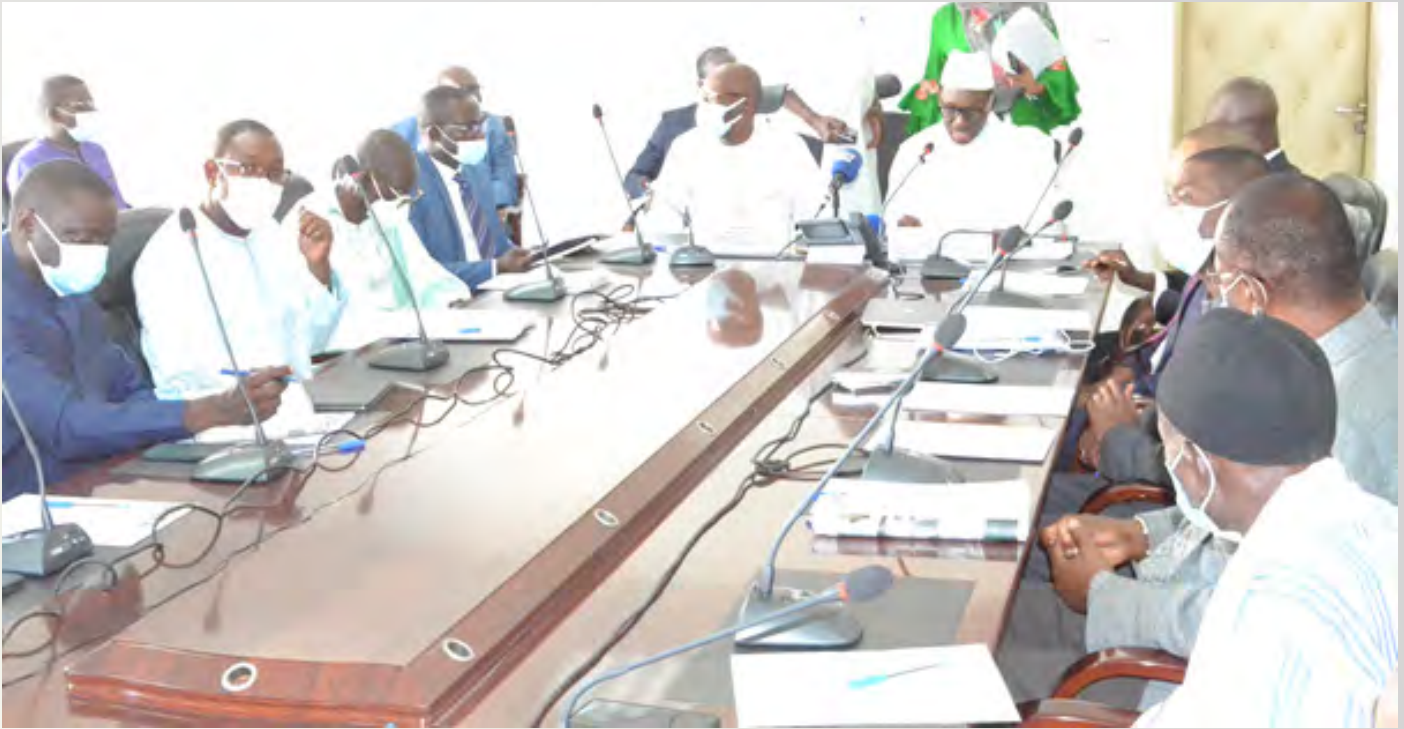
Les Editeurs à l'occasion de la rencontre de partage et de validation des nouveaux textes qui les régiront.