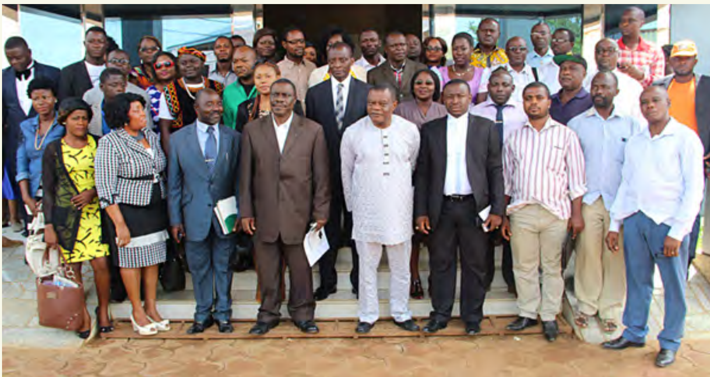
Photo de famille regroupant les régulateurs et les professionnels des médias