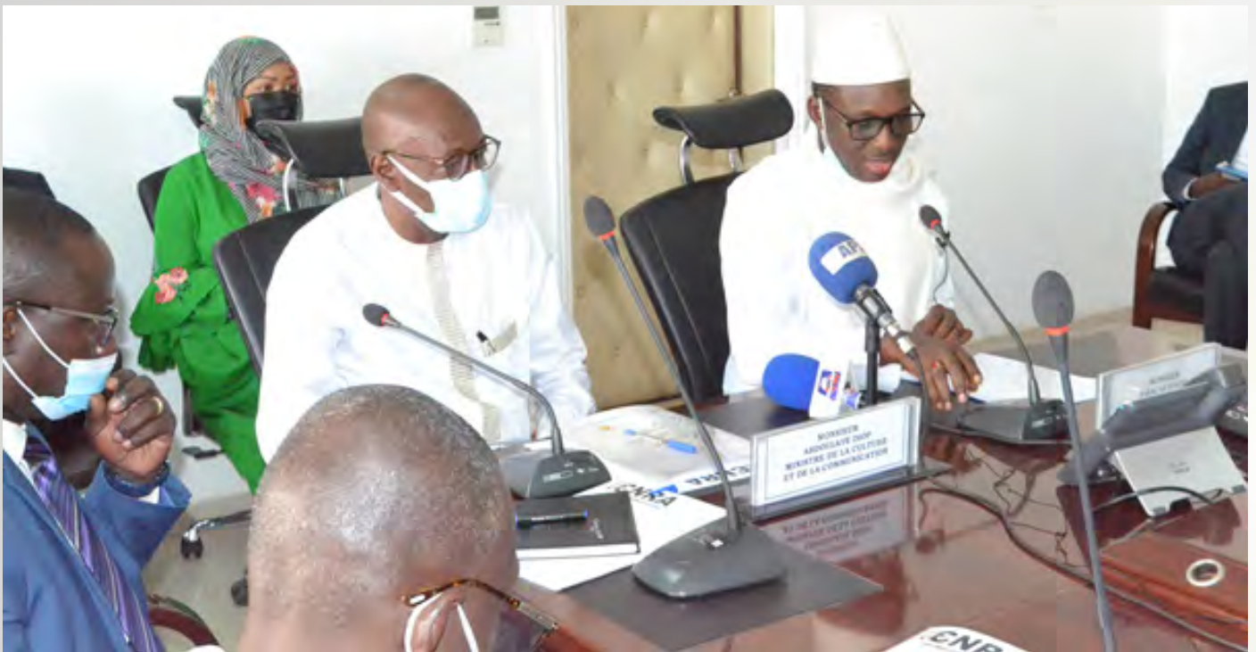
M. Abdoulaye DIOP, Ministre de la Culture et de la Communication et M. Babacar DIAGNE, Président du Conseil National de Régulation de l'Audiovisuel, à l'occasion de la cérémonie officielle d'ouverture de la rencontre de partage et de validation des textes applicables aux Editeurs télévisuels privés.

Le Conseil national de Régulation de l'Audiovisuel et le Ministère de la Culture et de la Communication ont organisé des rencontres de partage et de validation des textes applicables aux Editeurs télévisuels privés et aux Distributeurs de programmes de radiodiffusion télévisuelle et/ou sonore. Les rencontres se sont tenues au siège du Conseil national de Régulation de l'Audiovisuel.