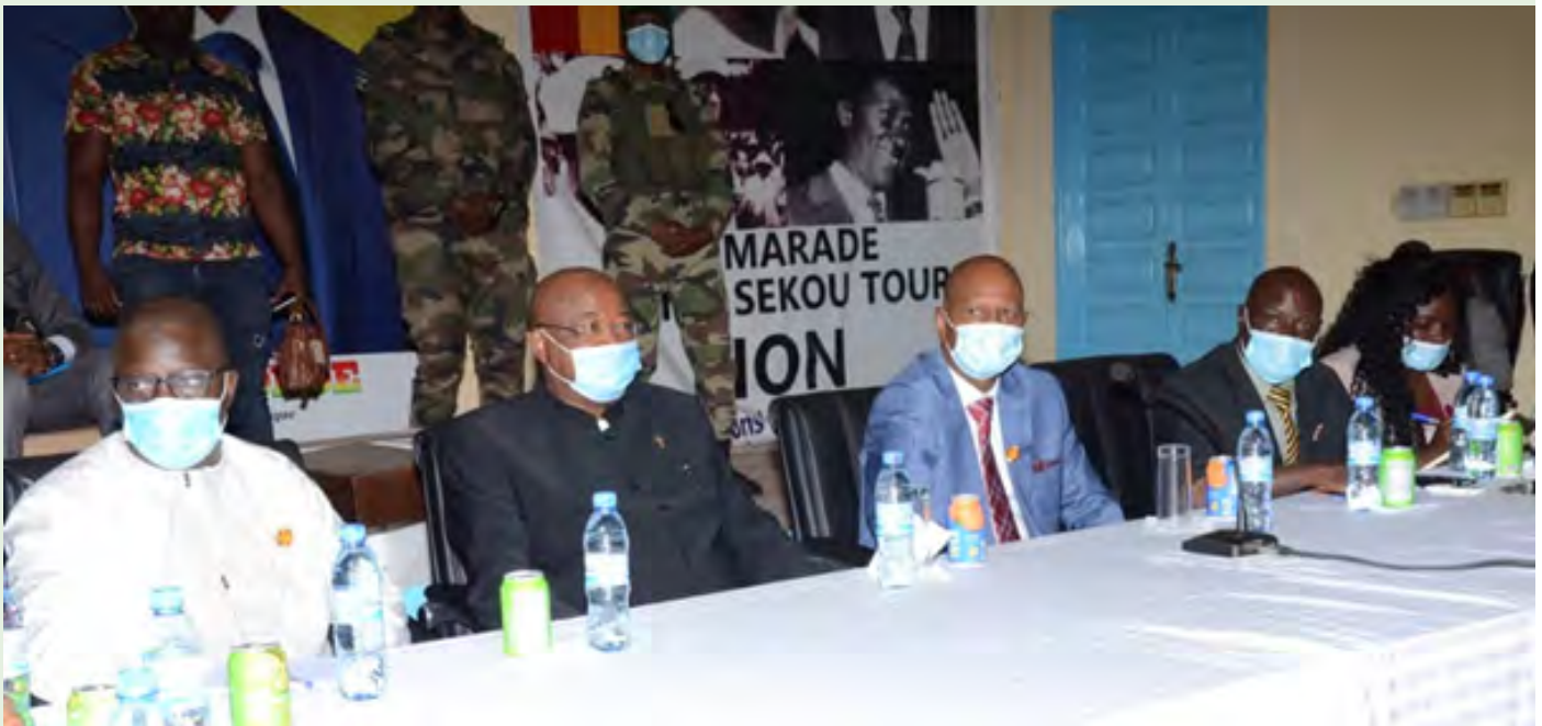
Vue partielle des membres de la délégation de l'opposant avec au milieu en costume bleu ciel le Président de la HAC M. Boubacar Yacine DIALLO

Dans le cadre de ses tournées visant à faire connaître son cabinet aux Institutions Constitutionnelles du pays, le nouveau chef de file de l'opposition, l'honorable Mamadou Sylla accompagné des membres de son cabinet était lundi, 25 janvier 2021 dans les locaux de la Haute Autorité de la Communication (HAC).