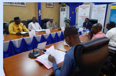
Séance de travail avec la délégation de la HAC du Mali et le Président de la HAAC et les Conseillers.