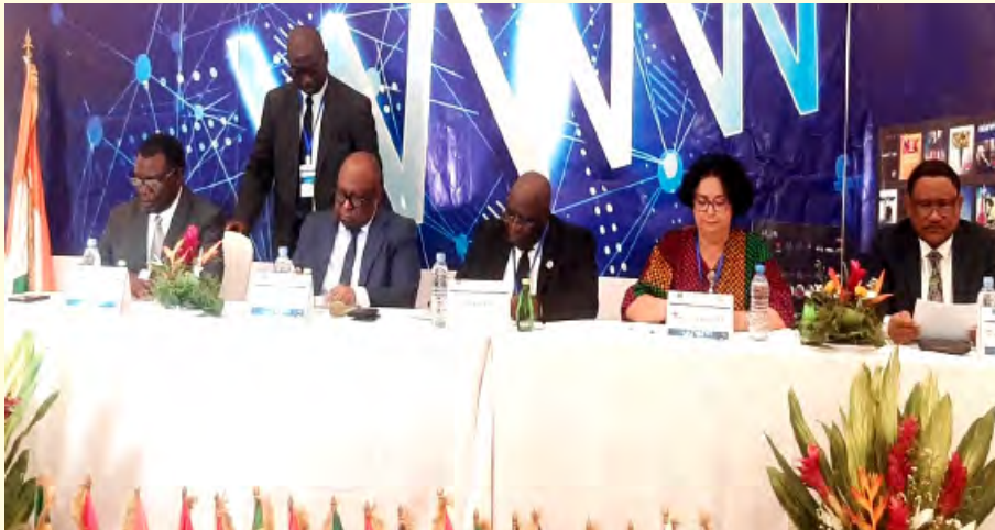
La tribune officielle à l'ouverture des travaux du colloque. De la gauche vers la droite, elle est composée des Présidents des instances de régulation du Cameroun, de la Côte d'Ivoire, du Maroc et du Bénin avec au milieu, le représentant du Président du CNRA Sénégal.