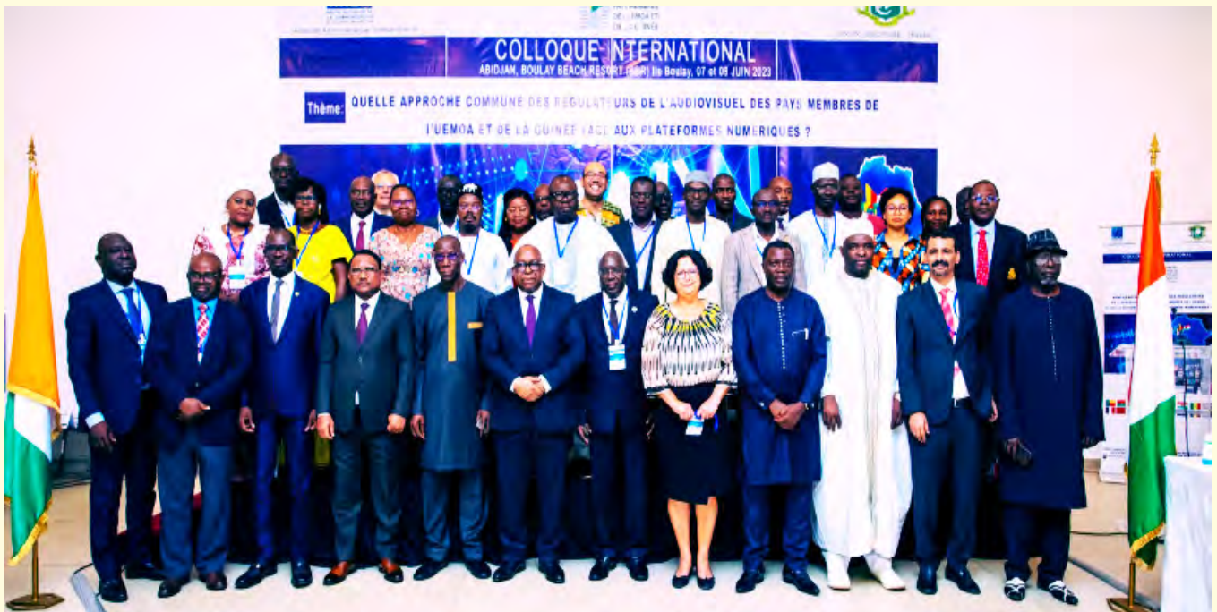
Photo de famille des participants

La Haute Autorité de la Communication Audiovisuelle (HACA) de Côte d'Ivoire a organisé les 07 et 08 juin 2023, à BOULAY BEACH RESORT (BBR) ILE BOULAY-ABIDJAN, dans le cadre des activités de la Plateforme des Régulateurs de l'Audiovisuel des pays membres de l'UEMOA et de la Guinée, un Colloque International sur le thème « Quelle approche commune des Régulateurs de l'Audiovisuel des pays membres de l'UEMOA et de la Guinée face aux Plateformes numériques ? ».