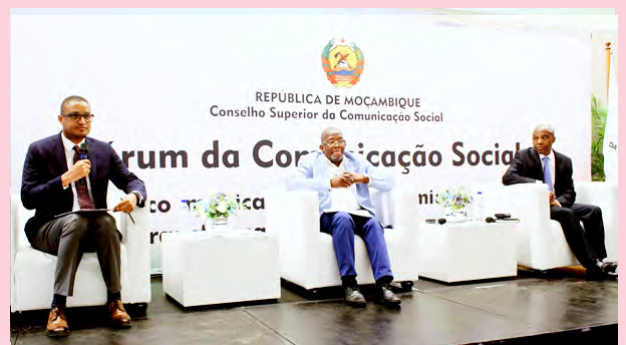
Quelques panelistes ayant animé le forum.

assistent, nous soutiennent dans cet immense tâche qui est l'édification d'un l'État de droit démocratique, à travers l'objectivation de la pluralité des médias, configurée comme un pilier essentiel de la démocratie.