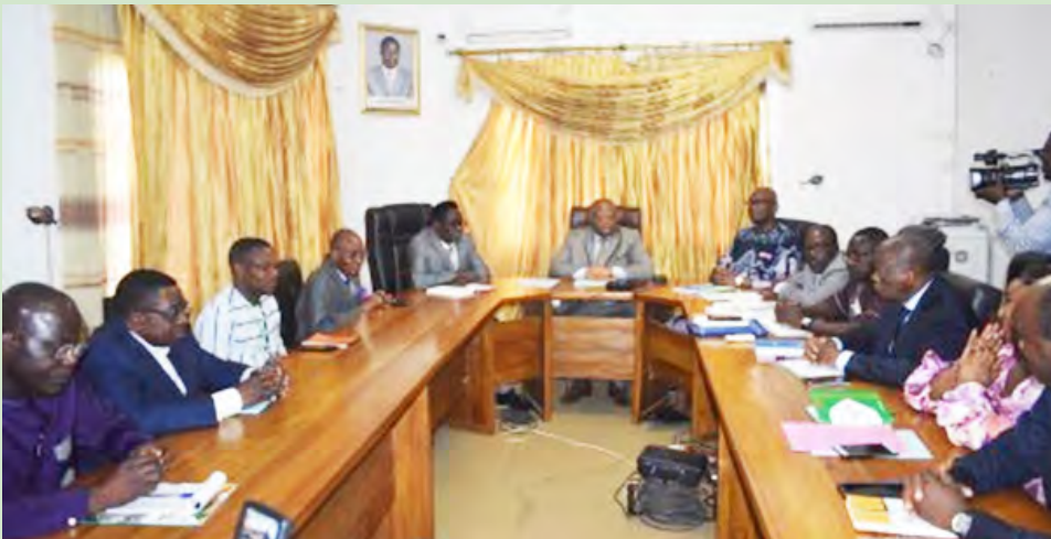
Les deux délégations, la CENI à droite et la HAAC à gauche

Le gouvernement togolais prépare activement les prochaines élections législatives et régionales. Dans cette perspective et conformément à l'article 10 alinéa 1 du Code électoral, qu'une délégation de la Commission Electorale Nationale Indépendante (CENI) a rencontré les membres de la Haute Autorité de l'Audiovisuel et de la Communication (HAAC). La rencontre avait pour but de réfléchir à cette collaboration dans la formation des agents des médias publics et privés ainsi que dans l'organisation de la campagne électorale. Les deux institutions se sont rencontrées au début du mois d'avril pour échanger sur une meilleure collaboration au siège de l'institution de régulation des médias à Lomé.