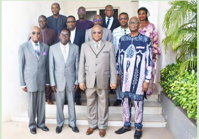
Photo de famille délégation CENI - membres de la HAAC

La HAAC et la CENI entendent œuvrer davantage à une synergie d'actions en vue d'une meilleure implication et responsabilisation des médias pour la réussite des prochaines échéances électorales. Il a été également question de la mise en place du comité conjoint CENI-HAAC pour une meilleure coordination des actions dans la formation des agents des médias publics et privés ainsi que dans