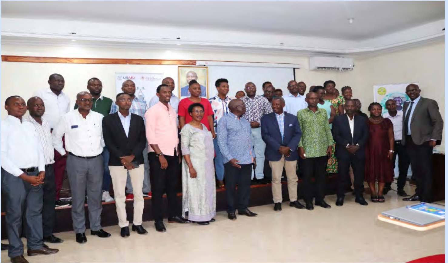
Photo de famille des participants à la session pour la première journée