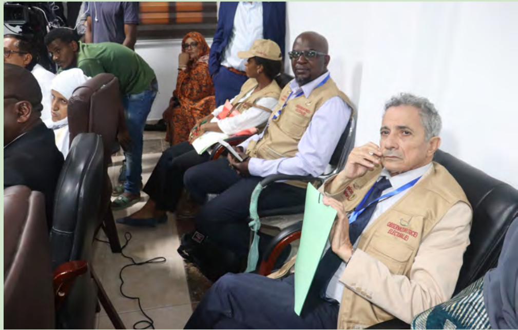
Vue partielle des participants

les partis politiques et les médias publics et privés, pour l'étroite collaboration tout au long du processus électoral.