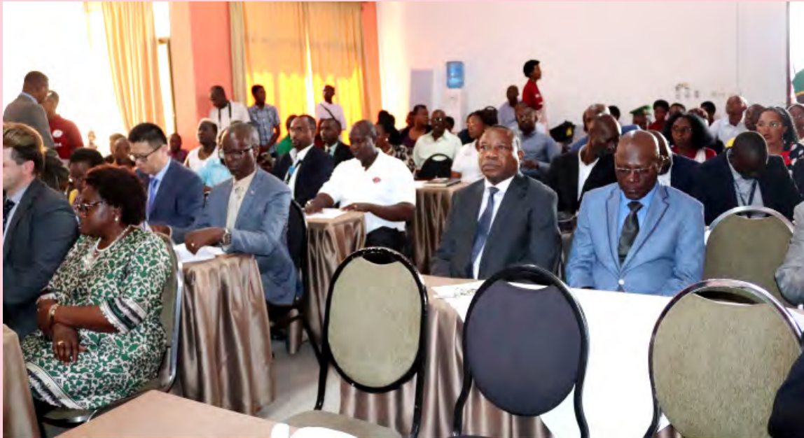
Vue partielle des participants aux cérémonies

Le CNC s'est rendu compte et se réjouit du fait qu'ils se sont adaptés au nouveau système de travail.