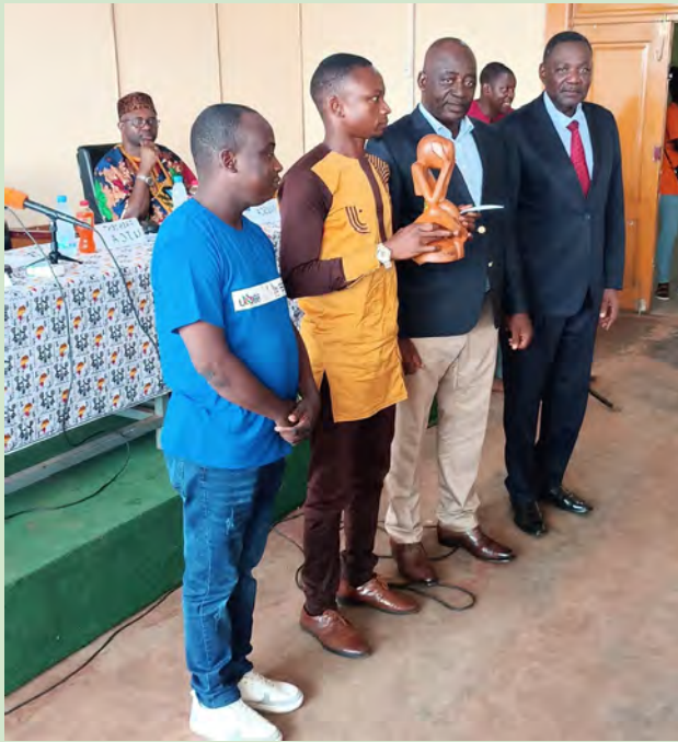
Vue remise du prix OLOFIO au représentant de la Radio BARANGBAKE

Les organisations professionnelles des médias, les journalistes et les étudiants du Département des sciences de l'information et de la communication (DSIC) ont célébré dans l'allégresse la journée mondiale de la liberté de la presse, à l'instar des hommes et femmes des médias du monde entier. Deux événements ont marqué cette journée : Conférence/débat suivi de la porte ouverte du département des sciences de l'information et de la communication qui a célébré ses 15 ans d'existence.