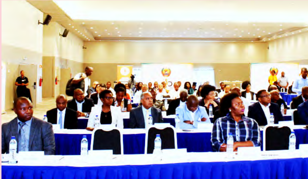
Vue partielle des participants

Le Forum de la communication sociale a permis une discussion ouverte sur les aspects de la communication sociale ; l'interaction et l'échange d'expériences entre journalistes de 3 générations, depuis l'approbation de la loi sur la presse en 1991 ; réflexion dans la classe journalistique sur son rôle et la question de l'éthique et de la déontologie à travers divers articles parus dans la presse ; l'analyse de la situation des médias au Mozambique et les défis dans l'exercice de la liberté