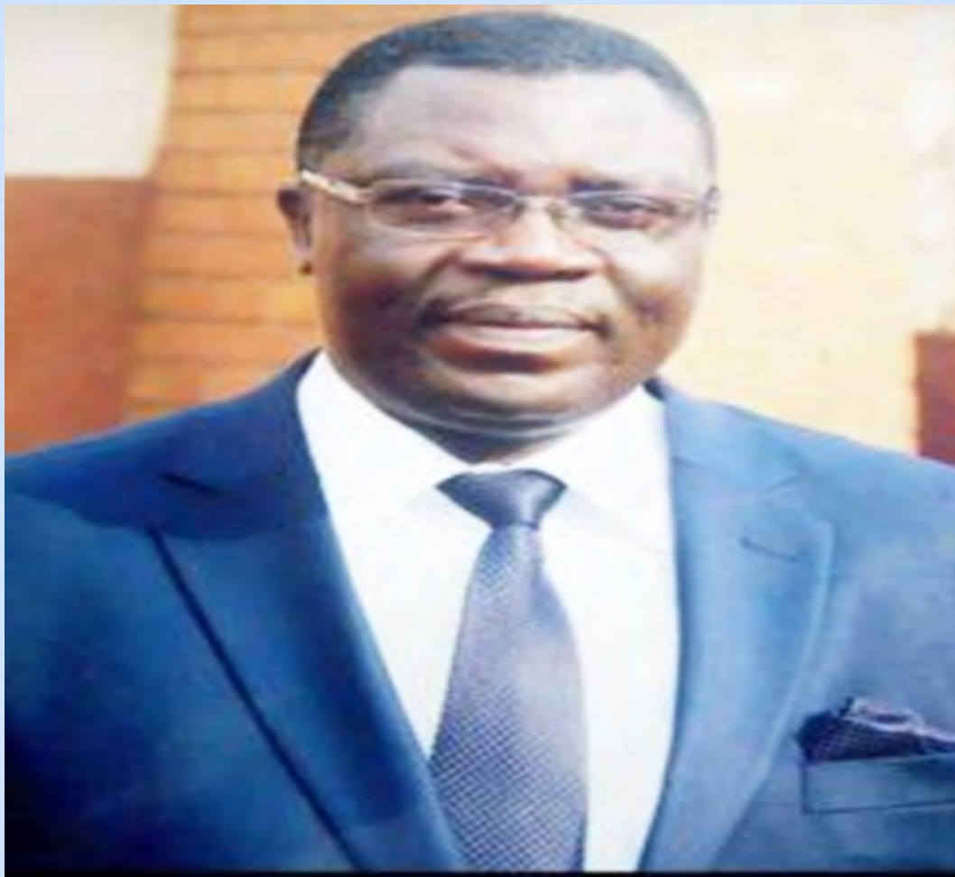
Le Président du CNC/Cameroun, M. Joseph CHEBONGKENG KALABUBSU

durée de 55 minutes, il est diffusé en boucle sur les antennes de l'office national de rediffusion camerounais ainsi que sur les antennes des médias privés qui ont adhéré au projet et ont offert gracieusement leurs espaces à sa diffusion. La campagne s'est poursuivie dans la ville de Douala où le CNC s'est déporté au sein des rédactions de certains organes de presse en vue de mener des échanges à caractère pédagogique avec les journalistes sur les mécanismes d'éradication du discours de haine dans leurs productions. Et entre temps, le CNC en tant qu'organe de consultation a émis un avis à l'endroit des pouvoirs publics. Un avis dans lequel il analyse les éléments de compréhension du discours de haine, dresse un état des