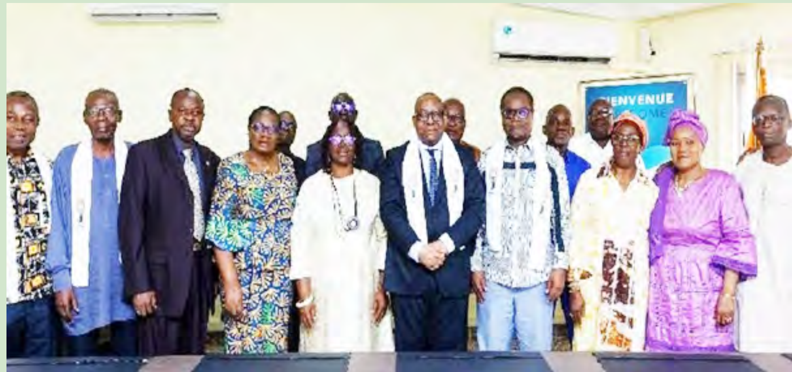
Photo des participants à la séance de travail