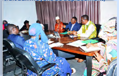
Vue partielle des participants lors de la séance de travail (en face à l'extrême gauche, le Président de la HAC Guinée).