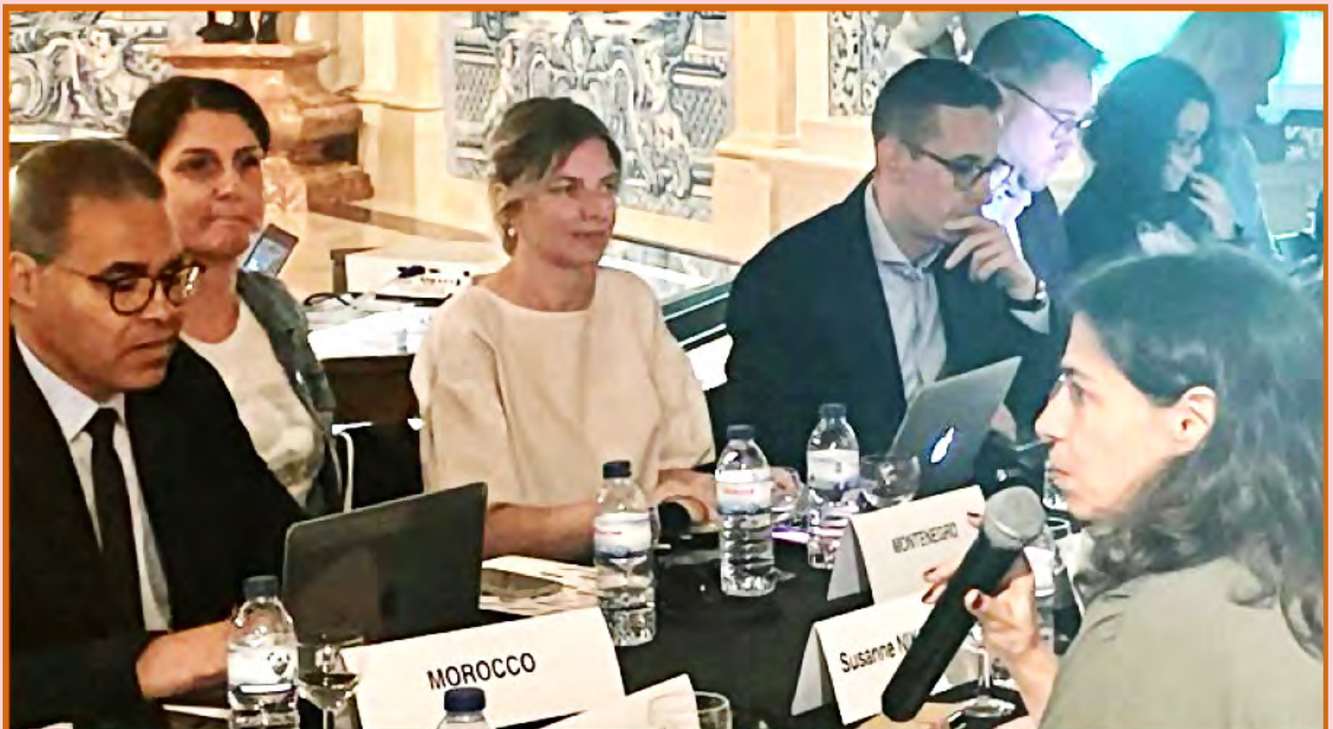
Vue partielle des participants à la réunion

A titre de rappel, la HACA avait été admise, en 2013,