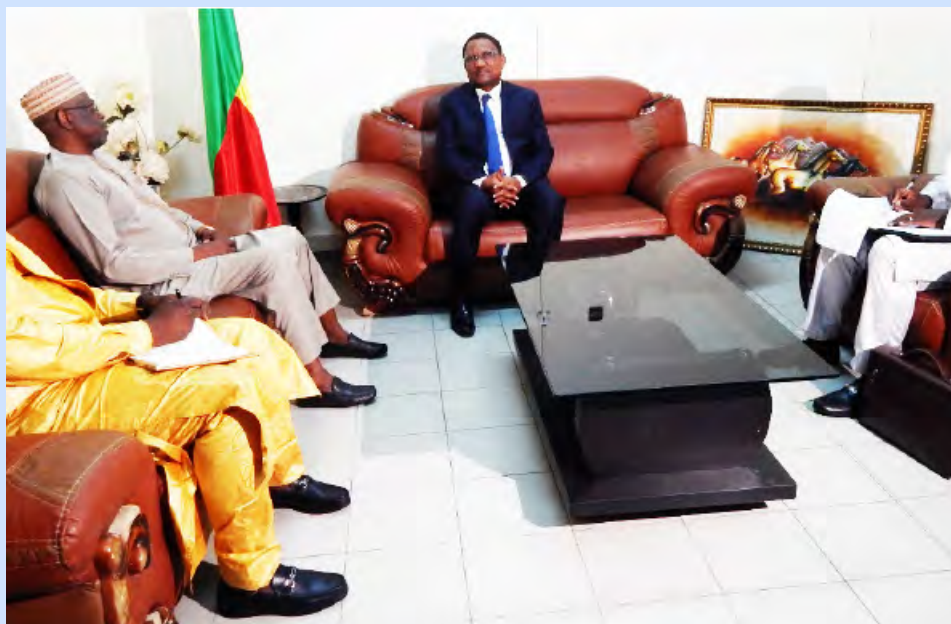
Un tête à tête entre la délégation de la HAC du Mali et le Président de la HAAC du Bénin.

Une délégation de la Haute Autorité de la Communication (HAC) du Mali a séjourné à Cotonou, du mardi 11 au mercredi 12 avril 2023. L'objectif de cette importante visite de travail et d'échange d'expériences est de s'enquérir de l'expérience du Bénin à l'effet d'améliorer leur pratique dans plusieurs domaines prioritaires de la régulation des médias.