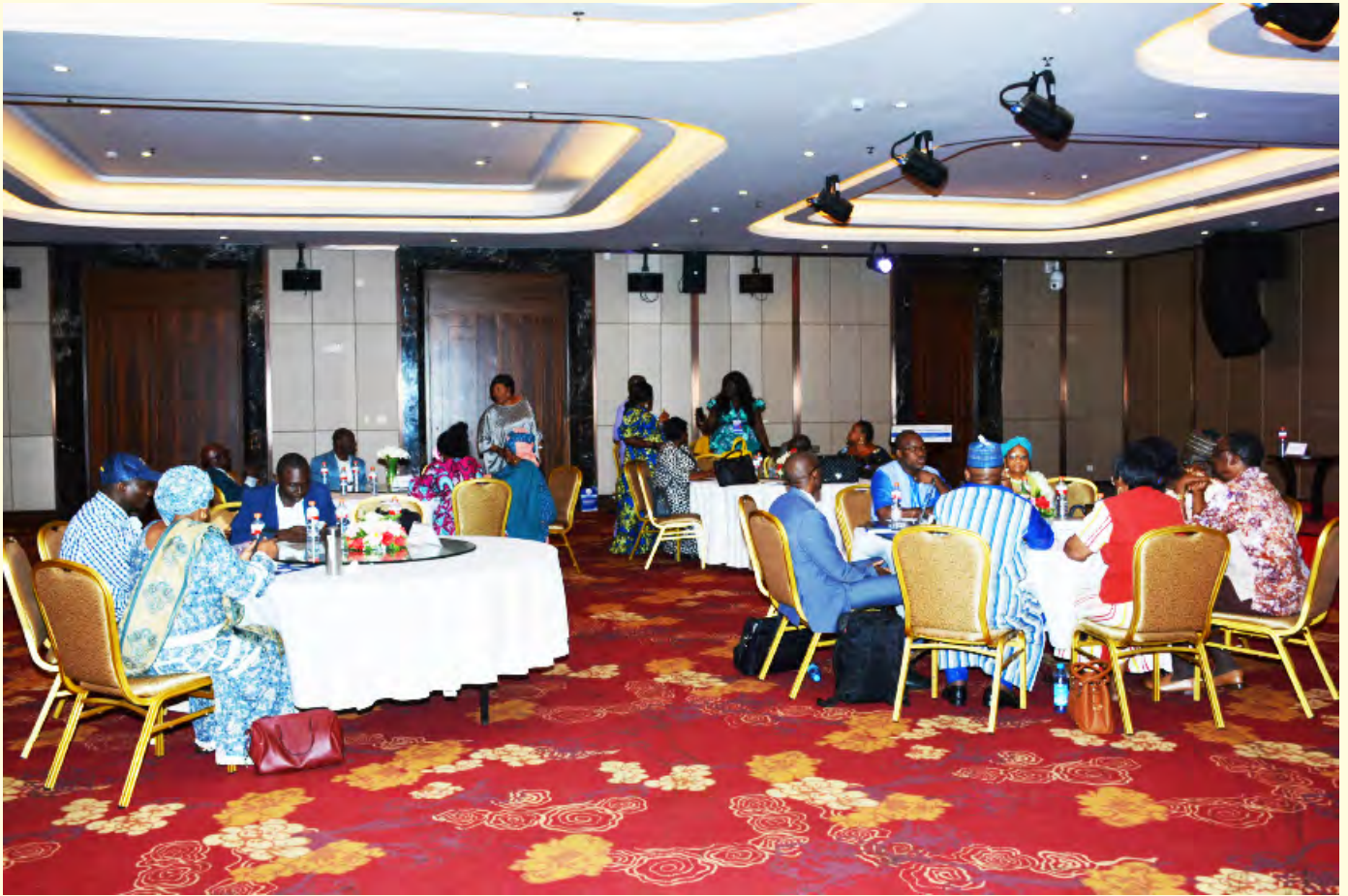
Vue partielle des participants au forum.

Colonel Mamadi DOUMBOUYA, aux efforts de ces trois Institutions de régulation, avant de saluer les idées novatrices issues des travaux de la première journée.