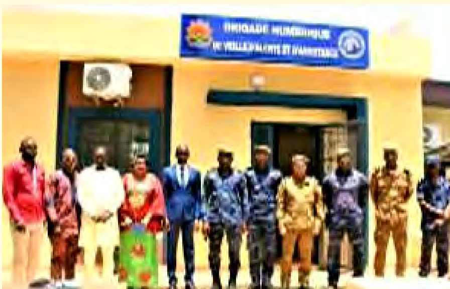
La photo de famille