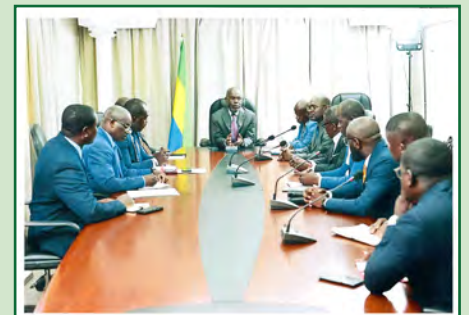
Vue partielle des participants à la rencontre.

Ils ont également saisi l'occasion de cette entrevue pour demander à la Haute Autorité de la Communication de se faire leur porte-voix auprès du gouvernement pour une meilleure prise en compte des préoccupations de la presse privée gabonaise, en butte à de nombreuses difficultés, parmi lesquelles celle relative à l'accès à la publicité institutionnelle.