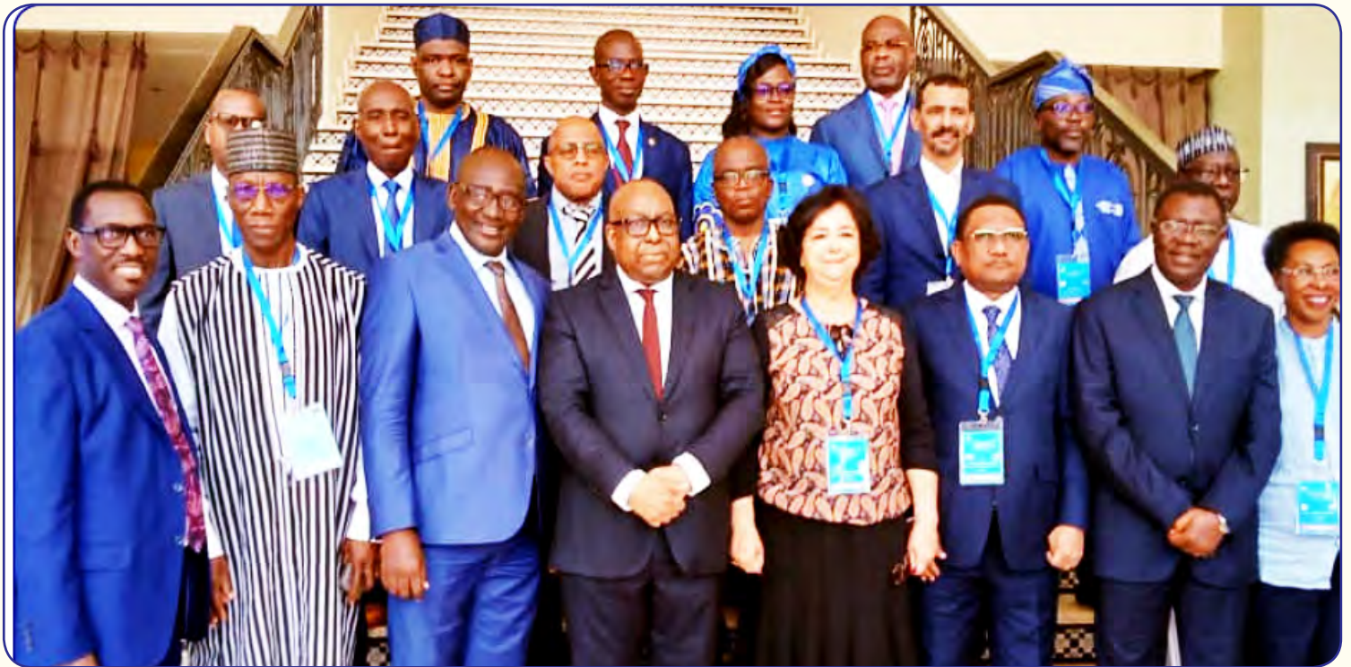
Photo de famille des Présidents et chefs de délégations des instances membres du RIARC ayant pris part à la conférence de Fès.