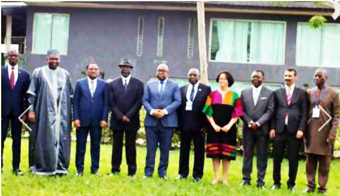
Photo de famille des Présidents ayant pris part au colloque