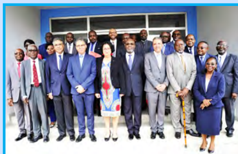
Photo de famille de la délégation marocaine et des membres de la HAC Gabon.

Ainsi, la collaboration actée par le paraphe ce jour de cette Convention-Cadre s'articule-t-elle autour de plusieurs axes, parmi lesquels : le partage par les deux instances de régulation de leur expertise