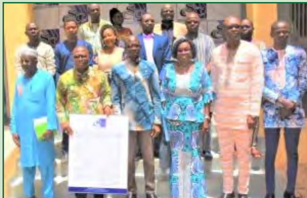
Un cadre du CSC, exposant sur les dix conseils

Pour lui, la diversité des acteurs de cette initiative permettra la promotion d'une utilisation saine, responsable et citoyenne des réseaux sociaux dans notre pays.