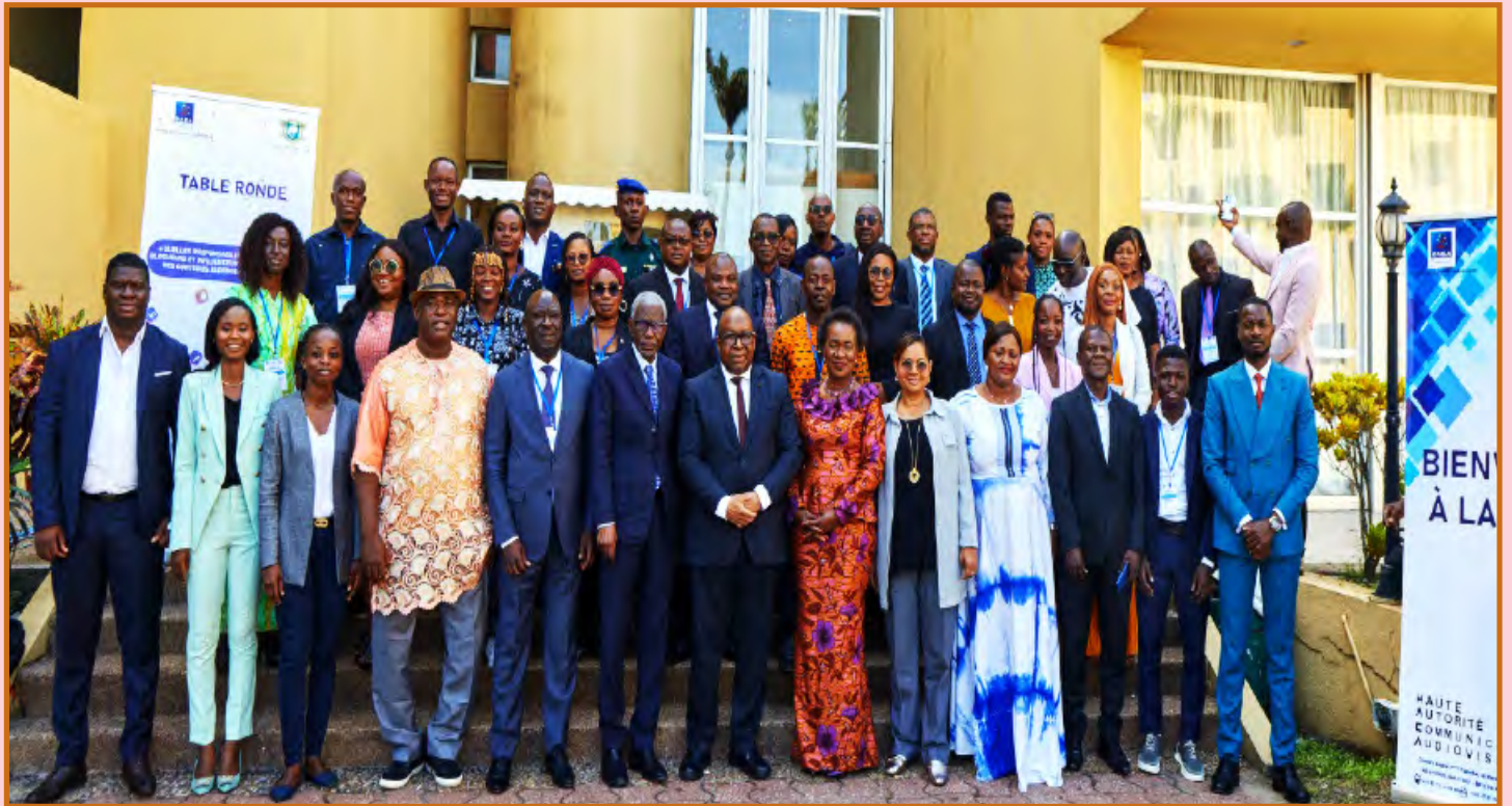
Photo de famille des participants à la Table Ronde

« QUELLES RESPONSABILITÉS DES ACTIVISTES, BLOGUEURS ET INFLUENCEURS DANS LA DIFFUSION DES CONTENUS AUDIOVISUELS EN LIGNE ? » ORGANISÉE PAR LA HACA DE CÔTE D'IVOIRE LE 17 MAI 2023 À HEDEN GOLF HÔTEL D'ABIDJAN.