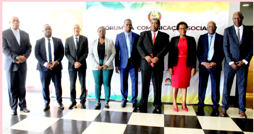
Photo de famille des membres du CSCS Mozambique.

devoir d'exercer ce noble métier avec une responsabilité éthique et déontologique. Deuxièmement, et sachant que la guerre est le moment qui génère les plus grands dichotomie et clivage dans le monde, le débat s'élargirait sur la manière de concilier les médias et l'agenda responsable des médias, avec la demande d'accès à l'information d'intérêt public, sur la lutte contre le terrorisme qui tourmente la population et détruit les infrastructures, notamment dans la région nord du pays. Il y aurait une opportunité de se concentrer sur la préparation des entreprises journalistiques, sans distinction, des rédacteurs et des journalistes en général, sur l'institution d'une Autorité de Régulation de la Communication Sociale, entre autres compétences, avec pouvoir de sanction, qui modèlera notre comportement et augmentera notre responsabilité dans l'exercice du métier de journaliste, avant tout. Enfin, une réflexion sera menée sur les implications matérielles et