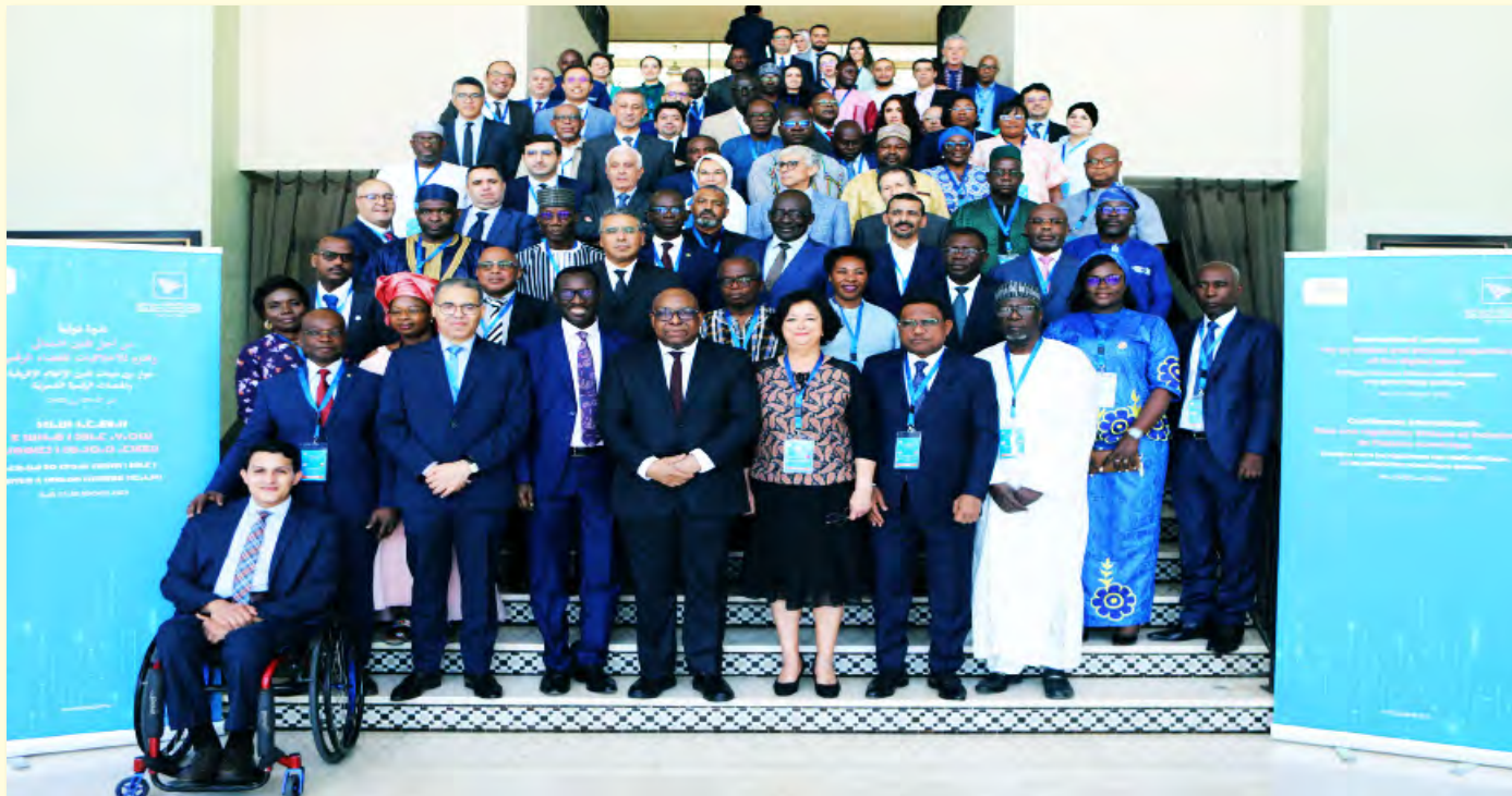
Photo de famille de tous les participants à la conférence.

A la suite des préoccupations exprimées par les Présidents d'Institutions de régulation et les participants, les représentantes des plateformes ont réaffirmé leur souhait de coopérer avec les régulateurs, décideurs politiques et experts technologiques. Elles ont déclaré avoir entendu le souci des régulateurs de voir une meilleure prise en compte de l'Afrique dans les politiques de modération. Les échanges qui ont suivi les présentations lors des panels ont révélé la nécessité de responsabiliser les Plateformes en ce qui concerne la question culturelle.