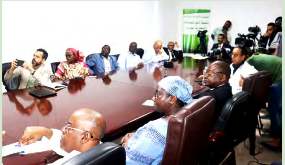
Vue partielle des participants

utilisé leur part d'annonces dans les deux journaux.