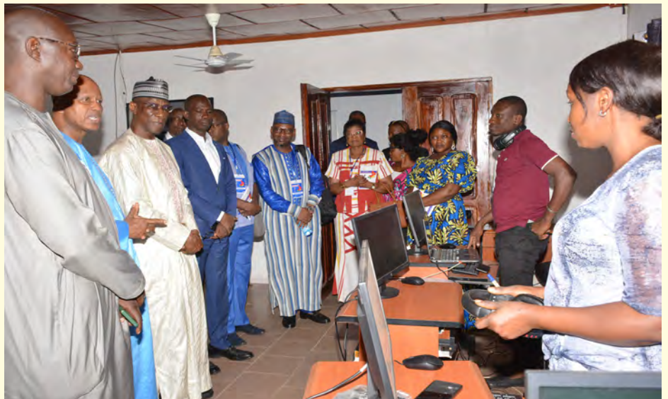
visite guidée des participants au centre de monitoring de la HAC Guinée

Intégrer la régulation des contenus des réseaux sociaux, des Web radio et Web Tv dans les attributions des instances de régulation des médias, renforcer le pouvoir du Régulateur pour lui permettre de prendre des décisions urgentes dérogeant aux règles classiques en période de crise, inclure la régulation des médias publics dans les compétences du régulateur, promouvoir l'inclusivité linguistique à travers l'utilisation