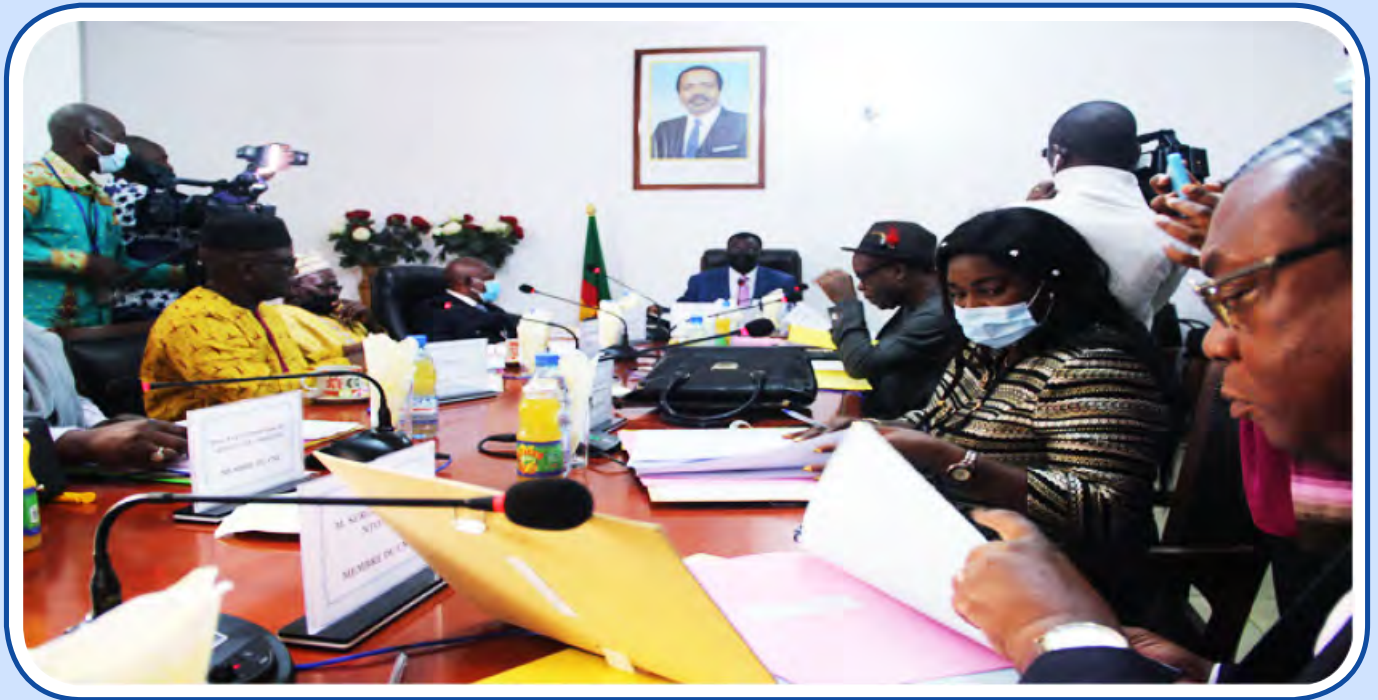
Séance plénière au CNC du Cameroun

« A l'occasion des élections des sénateurs qui se sont déroulées en mars 2023 au Cameroun, le Conseil National de la Communication (CNC) a une fois de plus déployé son système de monitoring sur toute l'étendue du territoire pour remplir sa mission de veille de campagne électorale ».