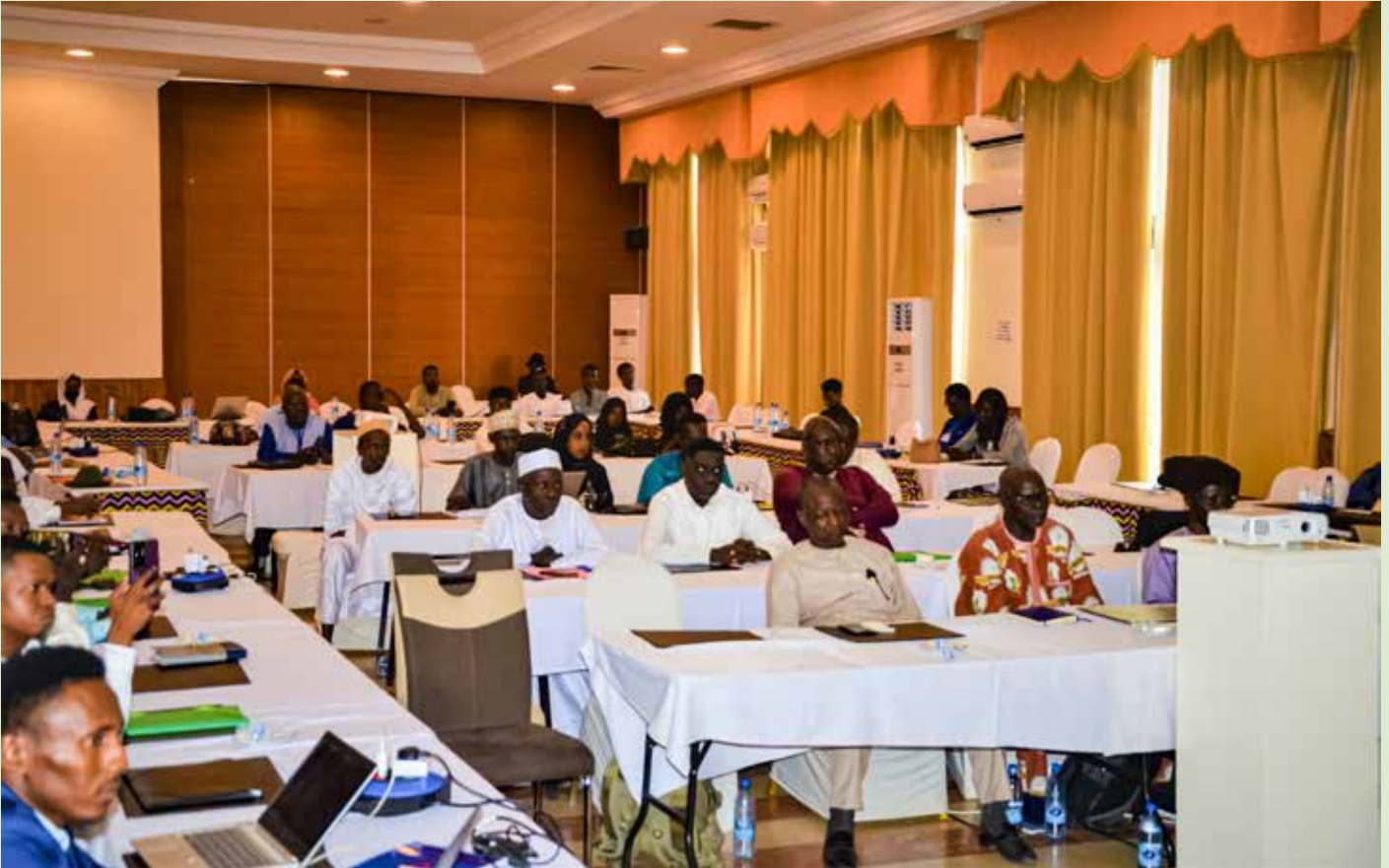
Vue partielle des participants aux séances de formation initiées par le HAMA/TCHAD.

Du 09 au 14 octobre 2023, la Haute Autorité des Médias et de l'Audiovisuel (HAMA), en partenariat avec le Programme des Nations Unies pour le Développement (PNUD) a organisé trois ateliers simultanés à N'Djaména, Abéché et Moundou. Il s'agit des ateliers de renforcement des capacités des journalistes pour une meilleure couverture médiatique du referendum constitutionnel et des élections post-transition.