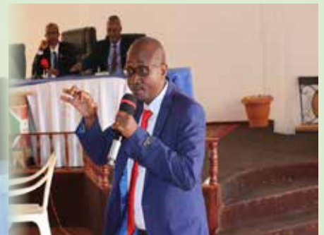
Vue partielle des conférenciers