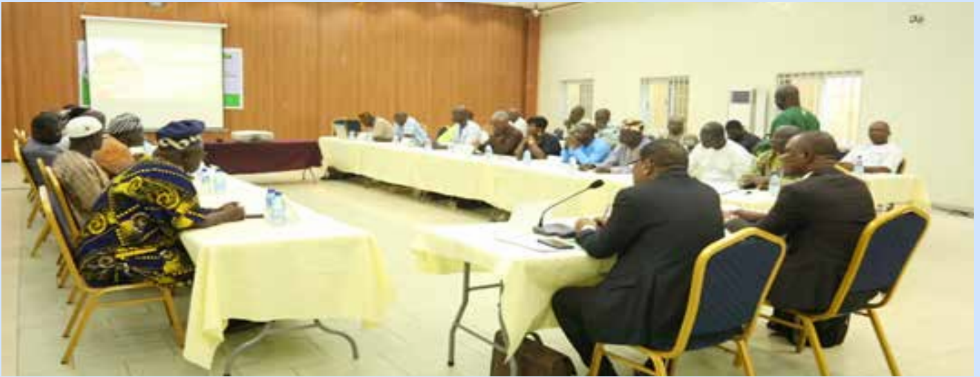
Séance de travail entre les Promoteurs et Directeurs des radiodiffusions sonores et le Président et les conseillers à la HAAC

La Haute Autorité de l'Audiovisuel et de la Communication (HAAC) a organisé, du 09 au 10 octobre 2023, un séminaire de formation des nouveaux promoteurs et Directeurs de radiodiffusions sonores sur le respect du contenu des conventions et des cahiers des charges.