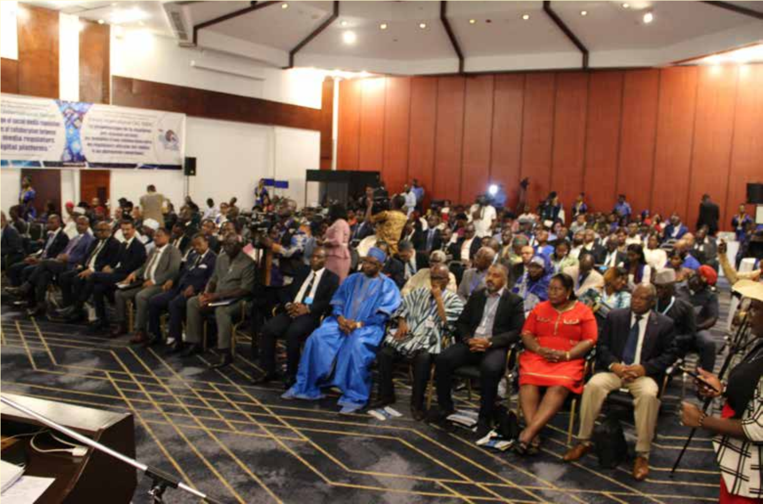
Vue partielle des participants au forum avec au premier plan les Présidents des instances membres du RIARC

d'encadrement de ces nouveaux médias de 5ème génération.