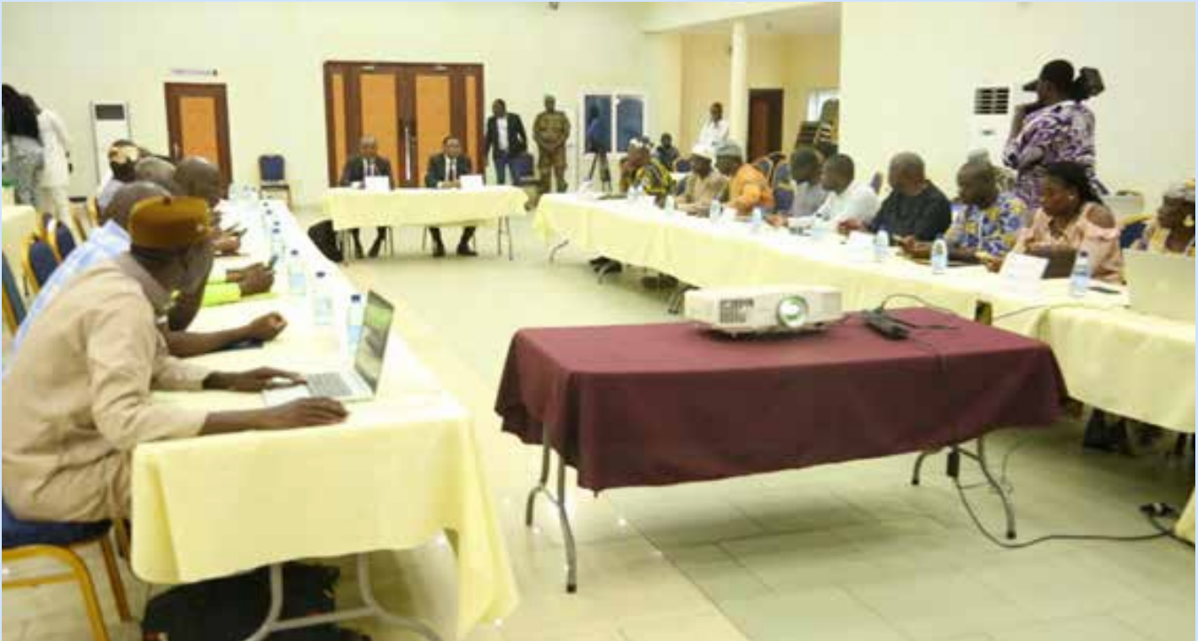
Vue des participants au séminaire

annuelle du droit d'auteur au BUBEDRA. Les redevances doivent être payées au plus tard le 31 décembre de l'année d'exercice. Les autres obligations administratives sont dues principalement vis-à-vis de la HAAC. Il s'agit de la production du rapport annuel d'activités et de la transmission de la demande de renouvellement de la convention.