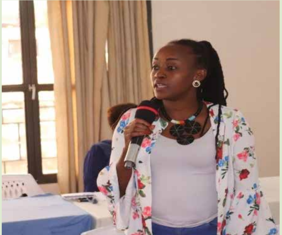
Une participante à l'atelier