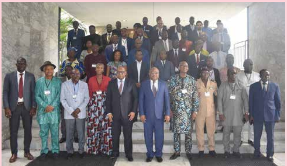
Photo d'ensemble des participants : avec les Présidents des deux instances de régulation des médias de Côte d'Ivoire et du Togo, sur la première ligne 5ème et 6ème de gauche à droite