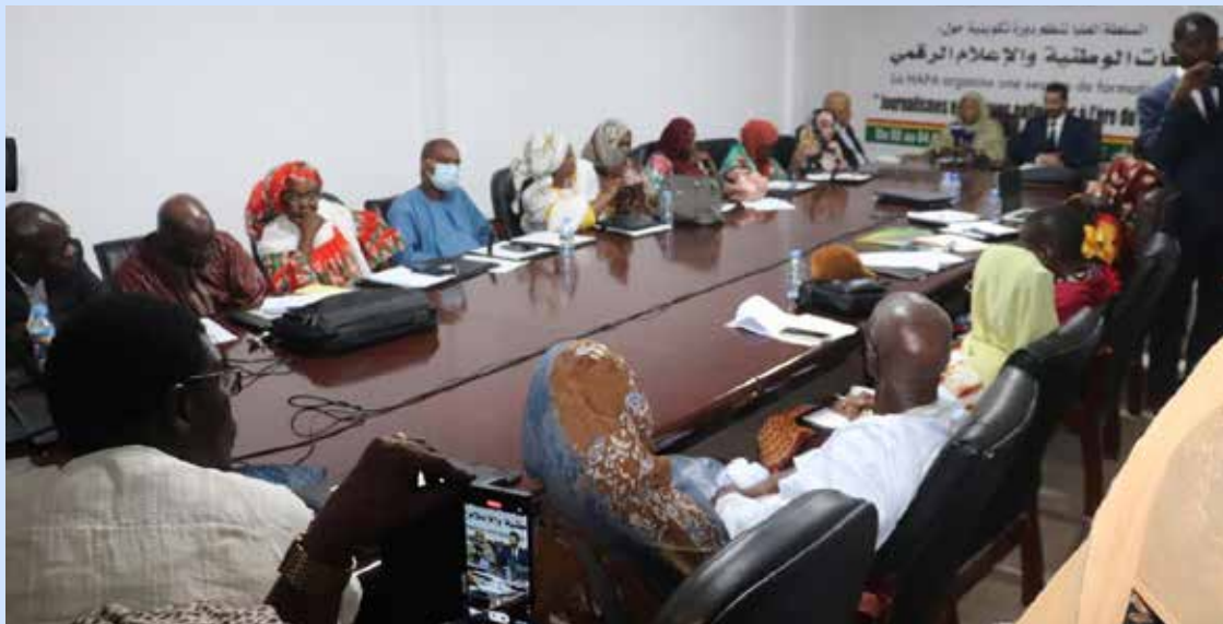
Vue partielle des participants à la formation

La Haute Autorité de la Presse et de l'Audiovisuel (HAPA) a organisé, mercredi 2 Août 2023 à Nouakchott, une session de formation sur : " Journalismes en langues nationales à l'ère du Numérique".