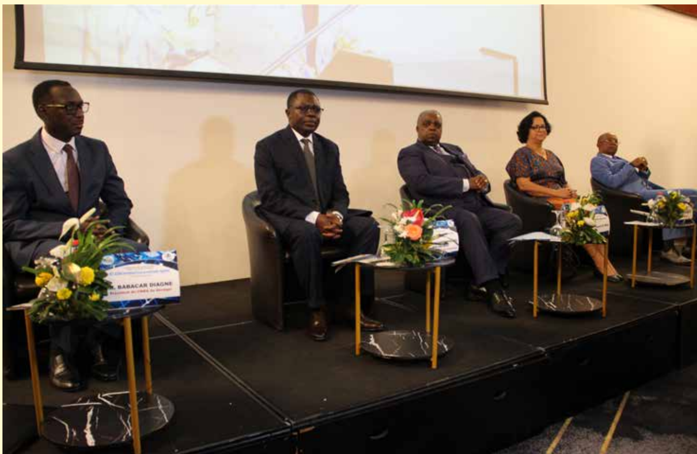
La tribune officielle à la cérémonie d'ouverture des travaux du forum.

Le Conseil National de la Communication (CNC) du Cameroun a organisé les 08 au 09 novembre 2023 un Forum International sur « La problématique de la régulation des réseaux sociaux : les modalités d'une collaboration entre les régulateurs africains des médias et les plateformes numériques ». Cette rencontre qui s'inscrit dans le cadre de la mise en œuvre du plan d'action 2023-2024 du Réseau des Instances Africaines de Régulation de la Communication (RIARC) a connu la participation d'une vingtaine de représentants des instances africaines de régulation des médias et des plateformes numériques.