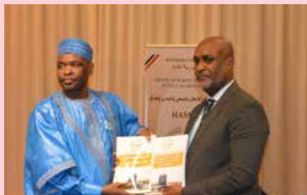
Remise du Rapport par le Président de HAMA/Tchad

L'équipe des évaluateurs a relevé des faiblesses managériales dues à un certain laxisme dans le suivi du personnel, mais surtout à la capacité jugée insuffisante d'un certain nombre de responsables de l'ONAMA, qui n'obéissent pas aux plans de carrière et ne répondent pas à des bases objectives et professionnelles. Si le Directeur Général de l'ONAMA