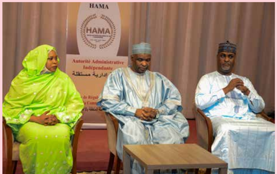
Le Président de HAMA/Tchad, au milieu et ses collaborateurs

Haute Autorité des Medias et de l'audiovisuel (HAMA) a procédé publiquement à la validation des données des organes de presse écrite et en ligne le 26 octobre 2023. Comme lors des