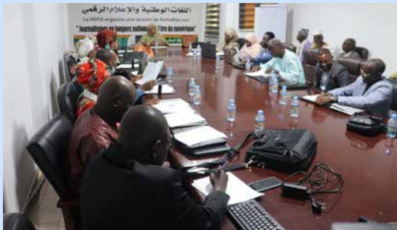
Vue partielle des participants à la formation