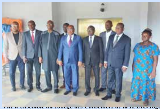
Vue d'ensemble du collège des Conseillers de la HAAC/Togo

émis le vœu que les travaux de la session produisent les résultats escomptés «