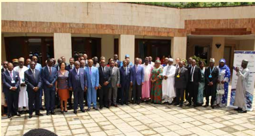
Photo de famille des participants au forum de Yaoundé sur la régulation des réseaux sociaux

Les travaux proprement dits ont duré deux journées. Ils se sont déroulés sous la forme de sections. Il y a eu au total quatre sections qui ont respectivement eu pour thèmes: