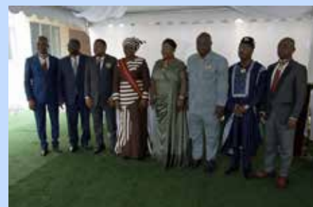
La photo de famille des récipiendaires et la Grande Chancelière des Ordres Nationaux