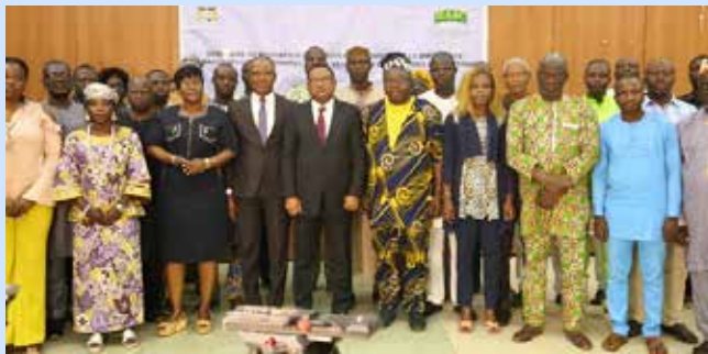
Photo de la famille

C'est l'hôtel Koubourou City de Parakou qui a servi de cadre au déroulement de ladite formation. Quatre (04) communications ont été développées pour meubler les travaux. Elles portent sur le contenu des cahiers des charges et des conventions.