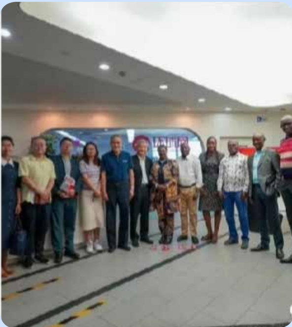
La Photo de famille de la délégation burundaise et la partie chinoise