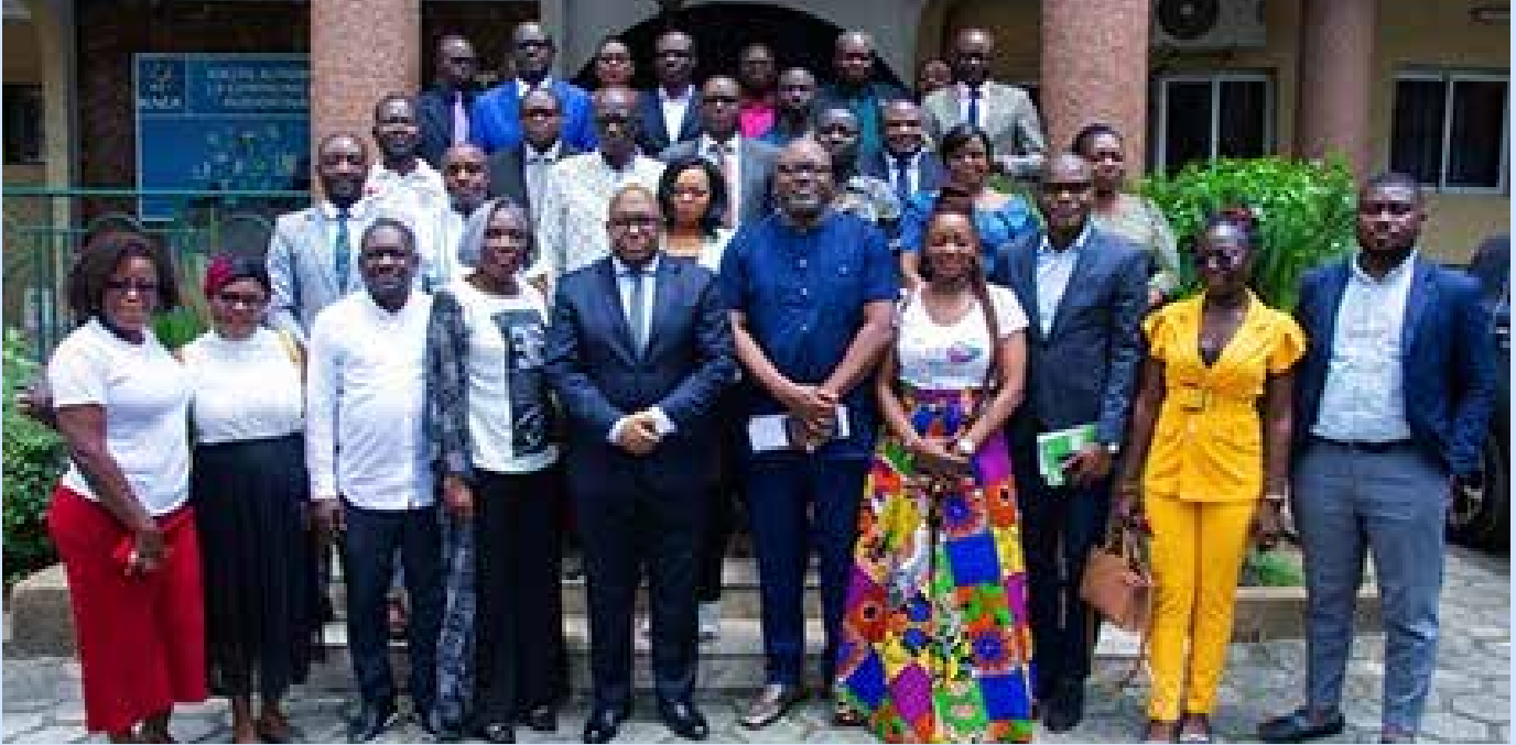
Photo de famille des Présidents ayant pris part au colloque

Suite à une journée découverte initiée par l'ONG Confrères Journalistes de Côte d'Ivoire, la Haute Autorité de la Communication Audiovisuelle a reçu à son siège, le mercredi 15 mars 2023, la visite d'une trentaine de journalistes à l'effet d'échanger sur les missions, actions et obligations de la HACA à la lumière de la loi n°2022-979 du 20 décembre 2022 modifiant la loi n°2017-868 du 27 décembre 2017 portant régime juridique de la Communication Audiovisuelle.