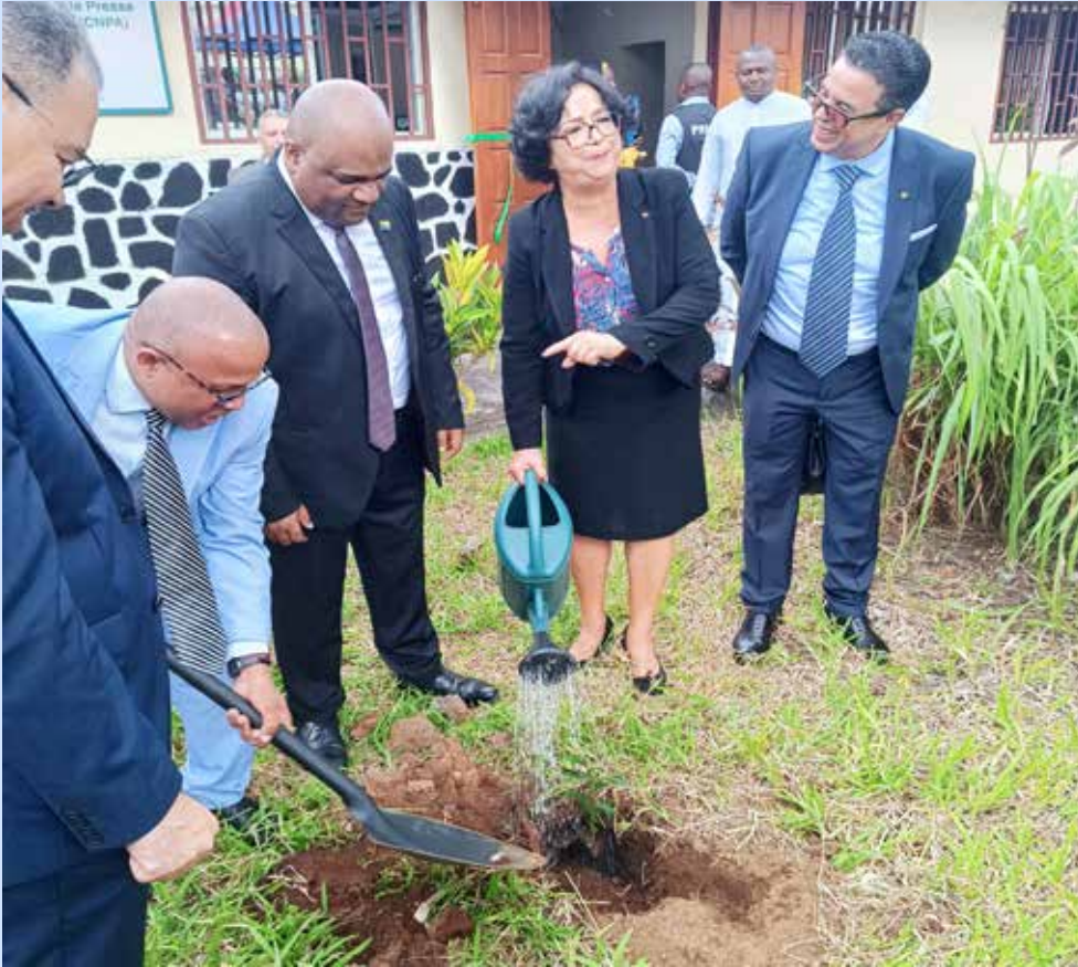
La Présidente de la HACA/Maroc plante un oranger pour marquer son passage au CNPA Comores

Le Conseil national de la presse et de l'audiovisuel (CNPA) a organisé, le 5 octobre 2023, à son siège à Moroni, une cérémonie officielle impressionnante pour inaugurer le centre de monitoring des programmes audiovisuels.