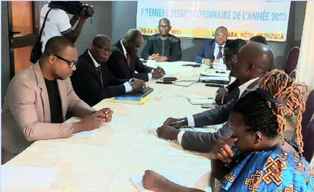
Le Président de la HAAC/Togo, Mr Pétalounani TELOU à l'ouverture de session

La Haute Autorité de l'Audiovisuel et de la Communication (HAAC) a organisé, du 10 au 14 juillet 2023, à l'hôtel La Mezhouza à Kara, les travaux de sa première session ordinaire au titre de l'année en cours. L'instance de régulation des médias avait sur sa table 68 dossiers de demande de délivrance ou de renouvellement de la carte de presse, 4 dossiers de demande de récépissé de déclaration de parution de la presse écrite et 12 autres dossiers de demande de récépissé de déclaration de la presse en ligne en mode écrit.