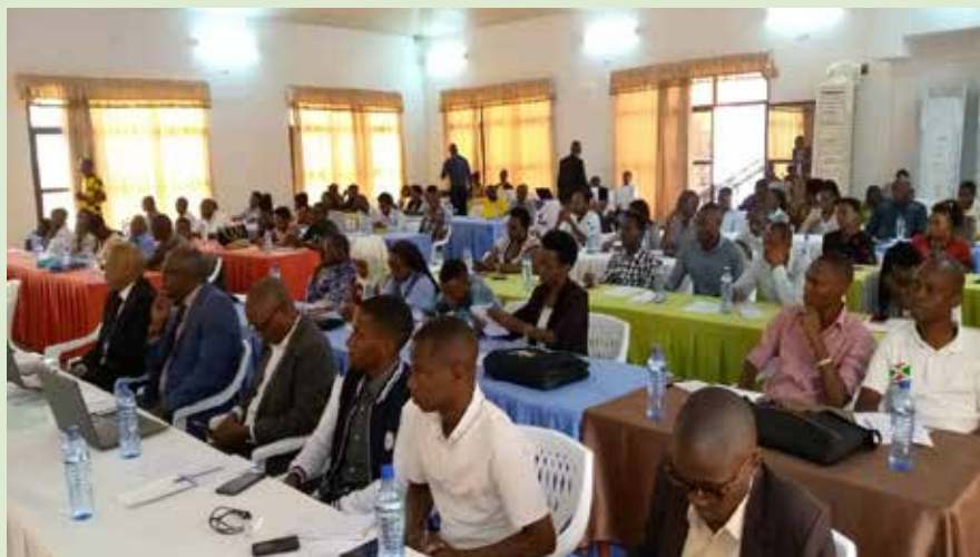
Vue partielle des participants à la formation

A cet effet, elle dit que, dans tout Etat démocratique, si le respect des principes de la bonne gouvernance occupe la première place, la transparence y occupe une place de choix. Dans ce cadre, non seulement le citoyen a droit de s'exprimer sur tous les sujets qui intéressent la vie