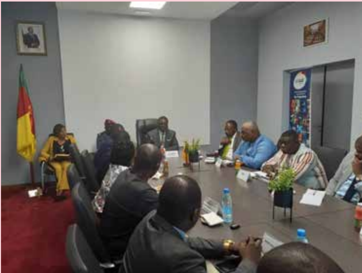
Vue partielle des participants à la séance d'échanges

Le Président du Conseil National de la Communication (CNC) du Cameroun, M. Joseph CHEBONGKENG KALABUBSU, s'est rendu ce mardi 19 septembre 2023 dans les locaux du Groupe l'Anecdote pour dispenser une leçon de journalisme sur la conduite des débats télévisés. Cette descente du régulateur fait suite à la récurrence des dérapages observés dans les programmes interactifs, le cas plus récent étant sur Vision 4.