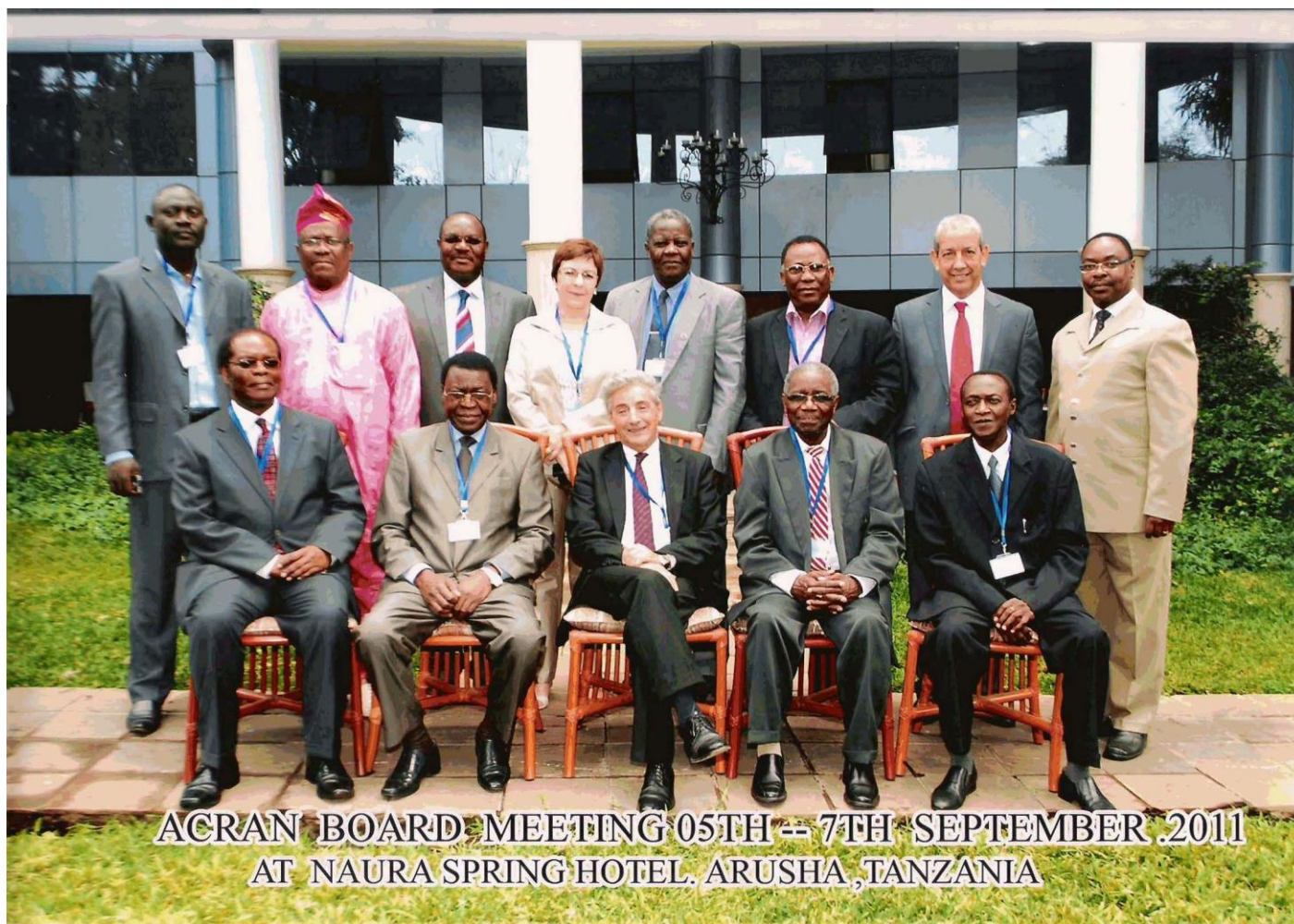
ACRAN BOARD MEETING 05TH -- 7TH SEPTEMBER 2011 AT NAURA SPRING HOTEL, ARUSHA, TANZANIA