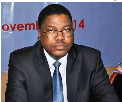
Président du RIARC