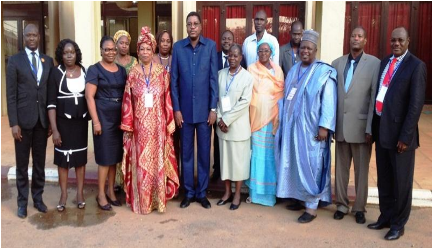
Photo de famille des participants à la deuxième réunion du Comité d'Orientation du RIARC