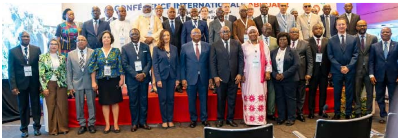
... au cours des travaux

Au terme des trois jours, les travaux de la rencontre ont abouti à l'adoption de la « Déclaration d'Abidjan », un document formulant des recommandations majeures sur la gouvernance de l'IA et la préservation de la liberté d'expression en ligne.