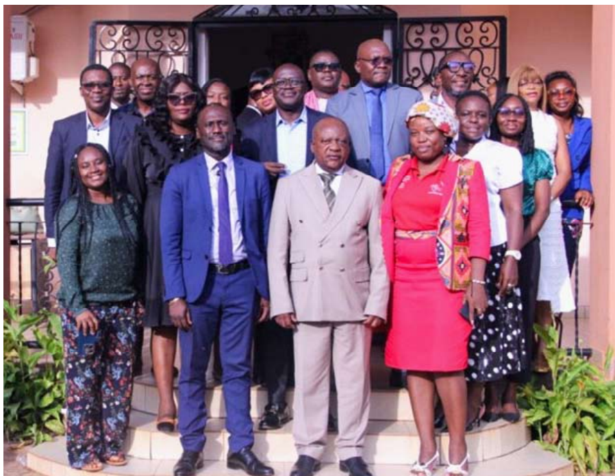
La photo de famille au terme de la visite....