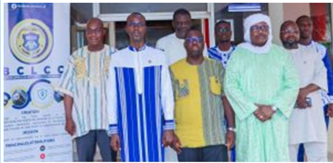
La photo de famille, au terme de la visite

Le président du Conseil supérieur de la communication (CSC), Wendingoudi Louis Modeste OUEDRAOGO, a conduit, le lundi 20 avril 2026, une délégation de l'Observatoire national de la communication (ONC) du Niger pour une visite à la Brigade centrale de lutte contre la cybercriminalité (BCLCC).