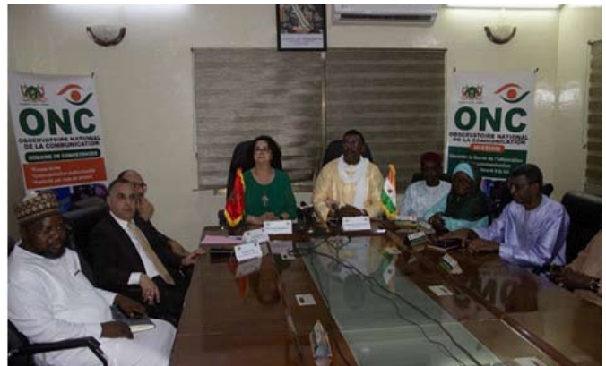
...et la séance de travail