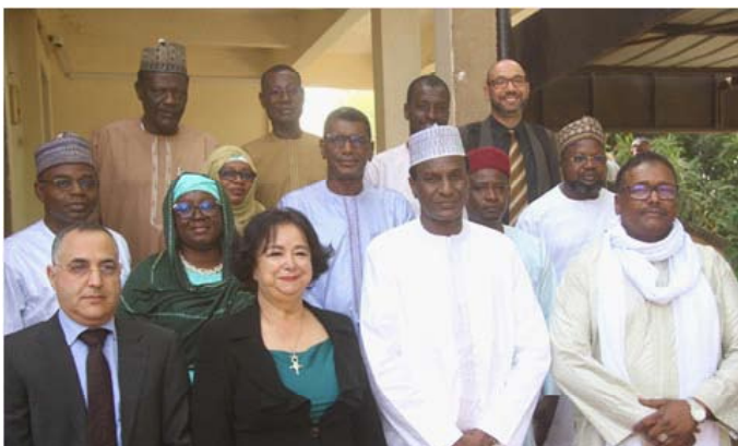
...avant la photo de famille