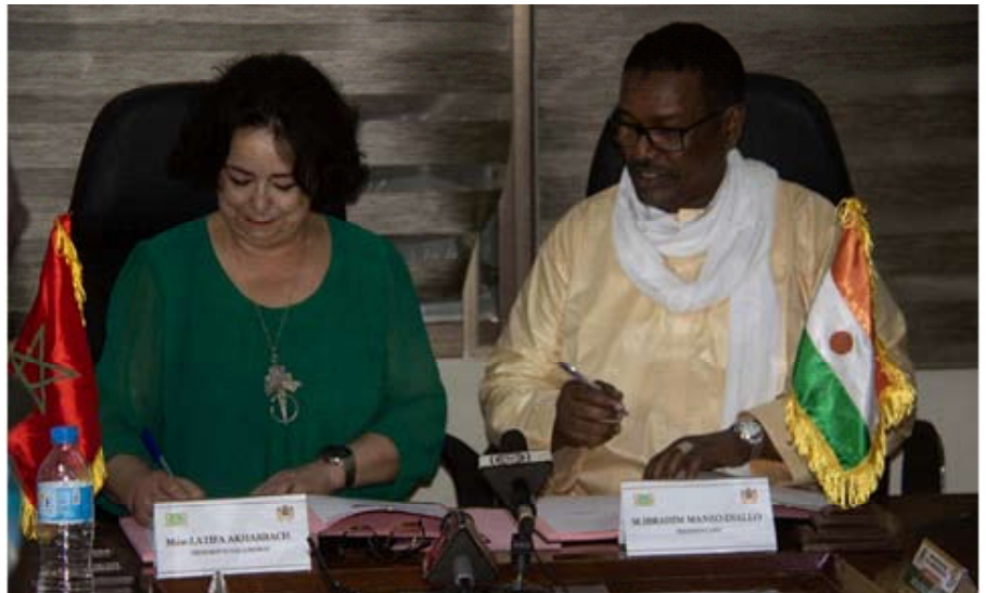
La signature de la convention...

Les consultations entre les deux instances de régulation ont porté sur plusieurs questions d'intérêt commun liées aux mutations de l'environnement médiatique, notamment l'adaptation des missions et des outils de régulation aux transformations indui-