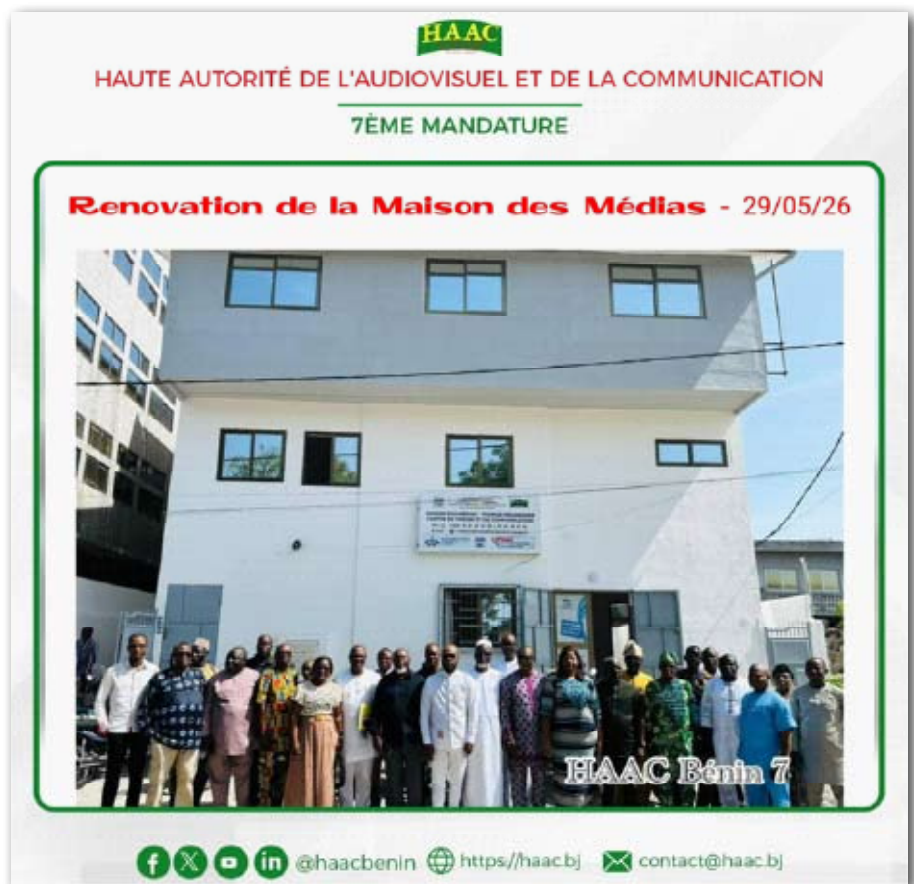
Les personnalités présentes à la réception du bâtiment

priez cette maison, que vous la gériez, parce que c'est notre maison, la maison de la presse. Nous avons connu beaucoup de bonheur ici. Nous voudrions que cela se poursuive. L'Aide de l'Etat à la presse n'est pas finie. Ayons des idées, ayons des projets qui profiteront à tout le monde. Faites des propositions à la HAAC (...)» a indiqué le Président Edouard LOKO.