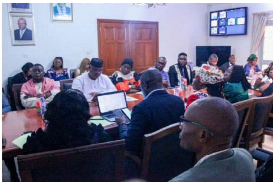
....et après la séance de travail