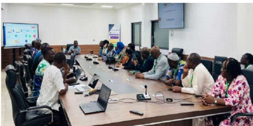
Le Secrétaire Général du Ministère de l'Intérieur et de la Sécurité Publique échangeant avec la délégation du RIARC sur le dispositif sécuritaire mis en place pour le bon déroulement du scrutin