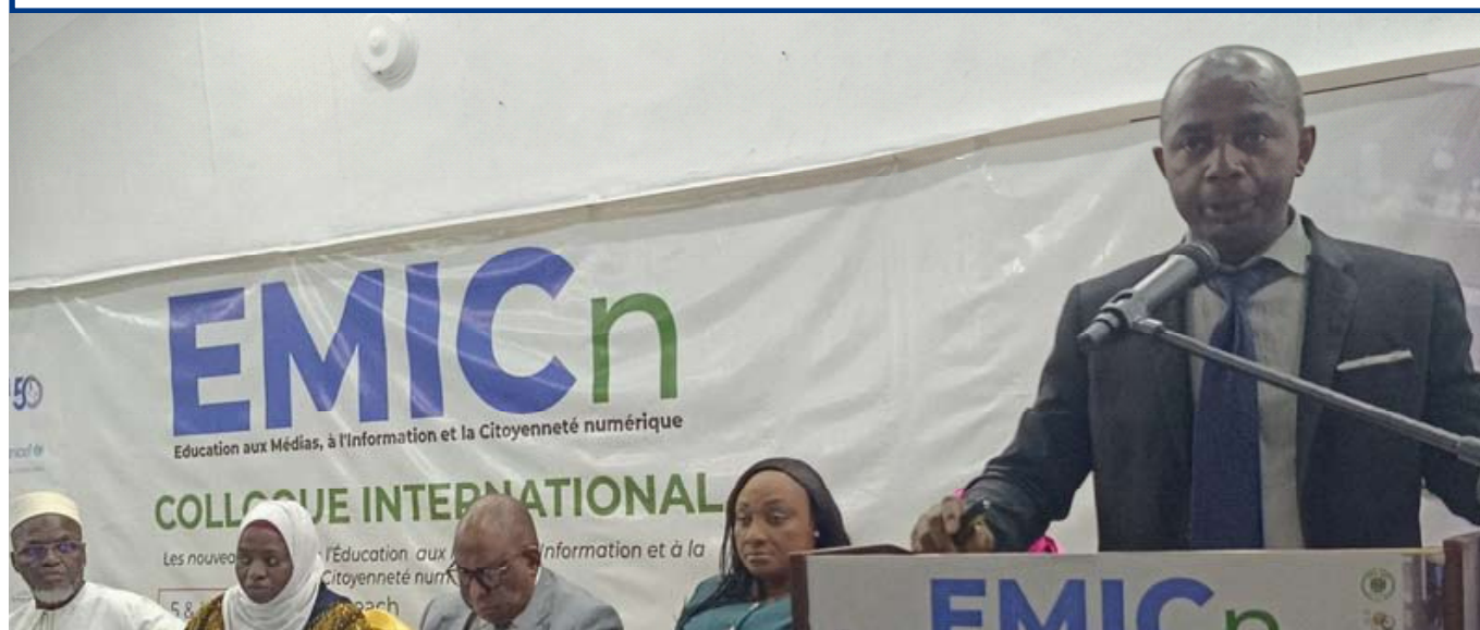
Séance plénière du Colloque international EMICn — Itsandra Beach Hotel&Resort, Moroni, 5 mai 2026.

Les 5 et 6 mai 2026, à l'invitation du Conseil National de la Presse et de l'Audiovisuel (CNPA) des Comores, treize instances membres du RIARC, aux côtés de partenaires internationaux — l'OIF, le Système des Nations Unies aux Comores et France Médias Monde —, se sont réunis à Moroni pour le premier colloque africain entièrement consacré aux nouveaux enjeux de l'EMICn. Ils en sont repartis avec six résolutions et une déclaration commune qui engagent les régulateurs du continent sur un agenda de souveraineté informationnelle.