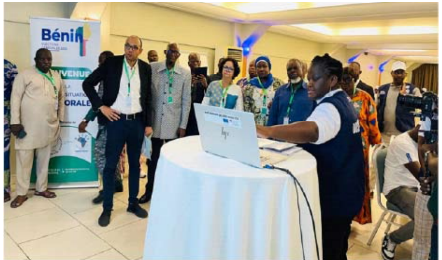
Présentation du dispositif de surveillance de l'élection présidentielle des OSC à la délégation du RIARC

Véritable quartier général installé à l'hôtel du Lac à Cotonou, la délégation a pu s'enquérir du rôle prépondérant que joue ce dispositif des organisations de la société civile. Subdivisée en quatre (04) cham-