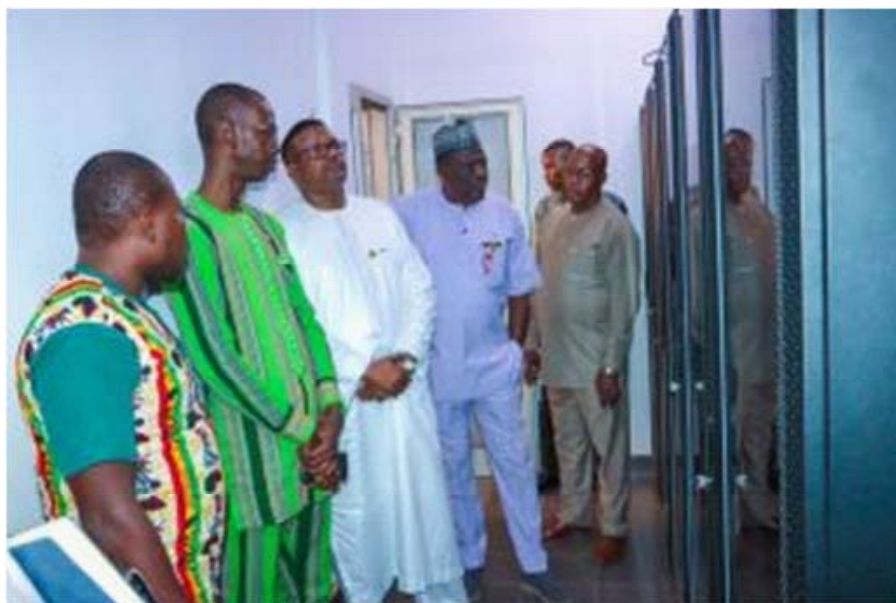
La séance de travail a été suivie d'une visite...