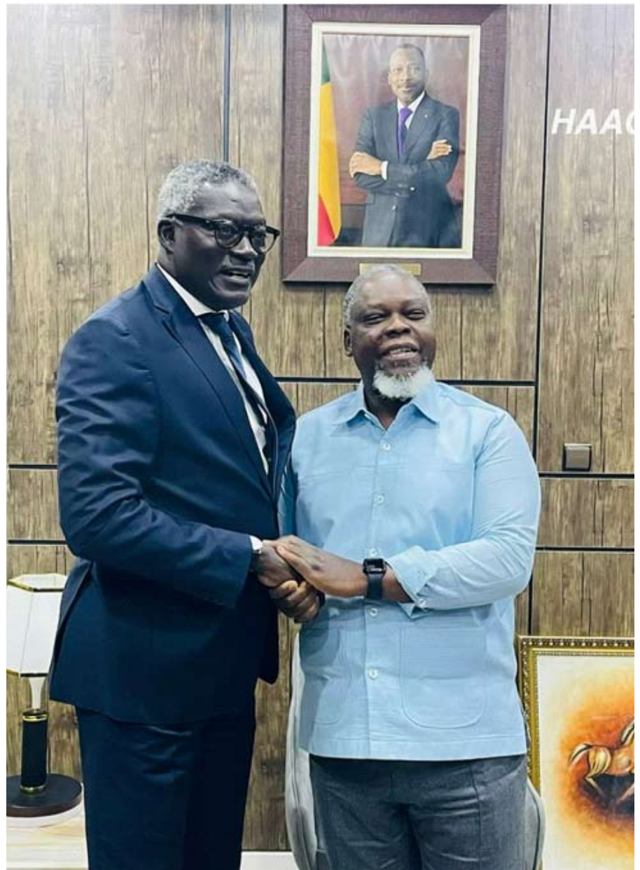
La poignée de main entre l'Ambassadeur Amadou DIONGUE et le Président de la HAAC en charge du SE/RIARC, Edouard LOKO

Les échanges ont notamment porté sur les défis actuels de la régulation des médias dans un contexte de transformation numérique accélérée. Face à la montée en puissance des plateformes numériques et au développement rapide de l'intelligence artificielle, les deux responsables ont souligné l'importance d'une régulation adaptée aux nouvelles réalités de l'information et de la communication.