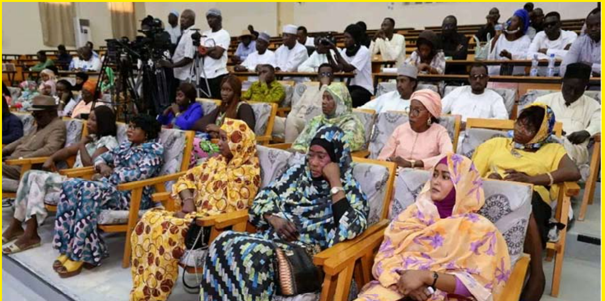
Vue partielle des participants à la manifestation

La Haute Autorité des Médias et de l'Audiovisuel (HAMA) a réuni les acteurs du secteur médiatique à l'occasion d'une cérémonie de présentation des vœux du Nouvel An, couplée à une rencontre d'échanges sur les défis et perspectives de la presse tchadienne.