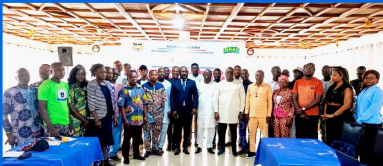
La photo de famille à l'ouverture des travaux du séminaire

Le lundi 18 mai 2026, s'est ouvert à Bis Hôtel à Abomey un séminaire de formation sur le rôle des médias dans la redevabilité des politiques publiques. Organisé par la Haute Autorité de l'Audiovisuel et de la Communication (HAAC), cet atelier bénéficie du soutien de la Coopération suisse au Bénin représentée par le groupe GFA.