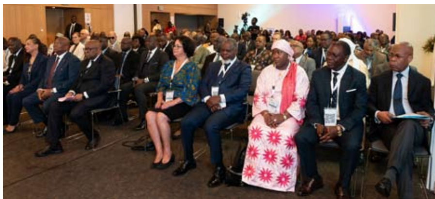
L'assistance à l'ouverture des travaux...